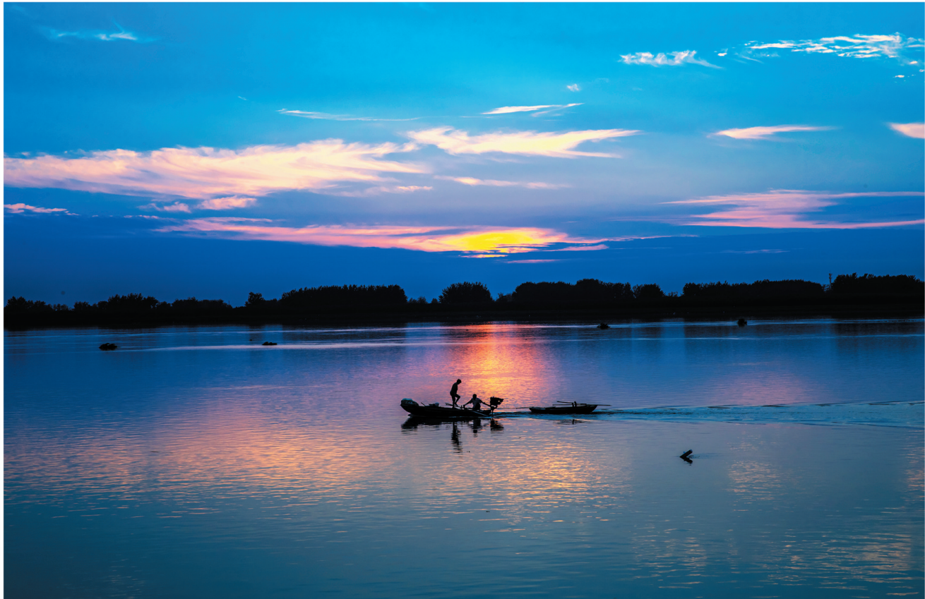
淮河风光—渔歌

对于农民,田地就是希望。大家坐在一起,东家有几亩,西家有几分,地薄地厚,聊得甚是详细。有田有地,就意味着一年缸中有粮,碗中有菜,生活有了方向。