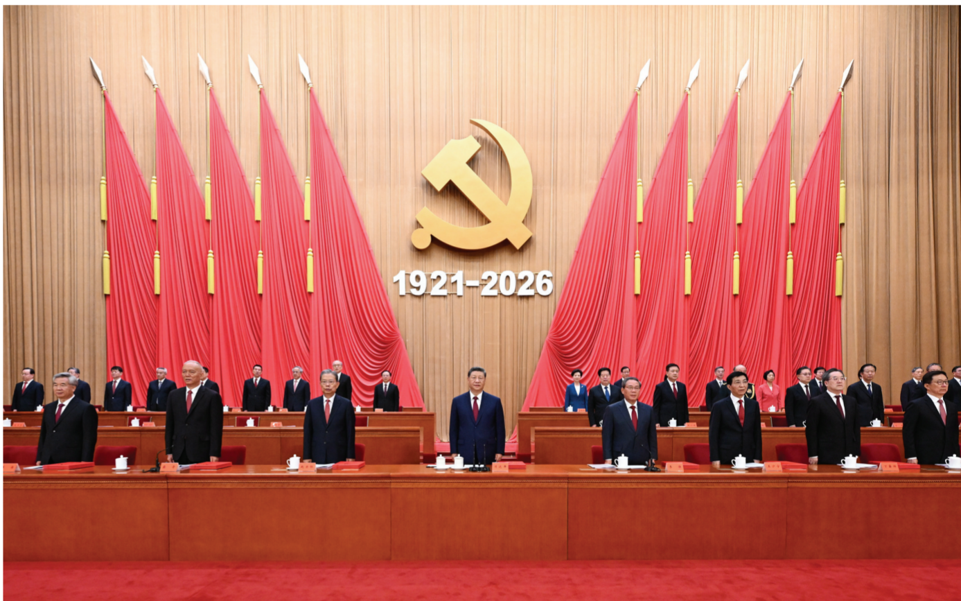
7月1日上午,庆祝中国共产党成立105周年大会在北京人民大会堂隆重举行。习近平、李强、赵乐际、王沪宁、蔡奇、丁薛祥、李希、韩正等出席大会。

新华社北京7月1日电 庆祝中国共产党成立105周年大会7月1日上午在北京人民大会堂隆重举行。中共中央总书记、国家主席、中央军委主席习近平向“七一勋章”获得者颁授勋章并发表重要讲话。他强调,105年来,我们党始终坚守为中国人民谋幸福、为中华民族谋复兴的初心使命,在不懈奋斗中创造了彪炳史册的伟大成就。新征程上,全党同志要坚定信心、接续奋斗,不断创造无愧于时代和人民的新业绩。