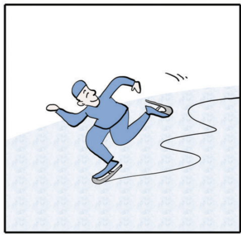
在薄冰上滑冰,速度就是安全。——爱默生