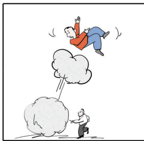
自尊心是一个鼓胀的气球,戳上一针就会发出大风暴来。——(法国)伏尔泰