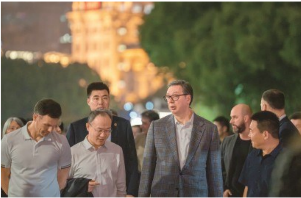
5月27日晚,塞尔维亚总统武契奇漫步外滩。

2026年2月26日,德国总理默茨将杭州作为访华第二站。他访问宇树科技,并率约30位德国头部企业高管访问西门口子能源与中国企业合资共建的杭州工厂。在杭期间,德国代表团与来自人工智能、人形机器人、新能源汽车等领域的10家中企深入交流。他的选择颇具风向标意义。杭州在数字经济、互联网科技、AI前沿上的独特优势,正吸引越来越多关注科技创新、产