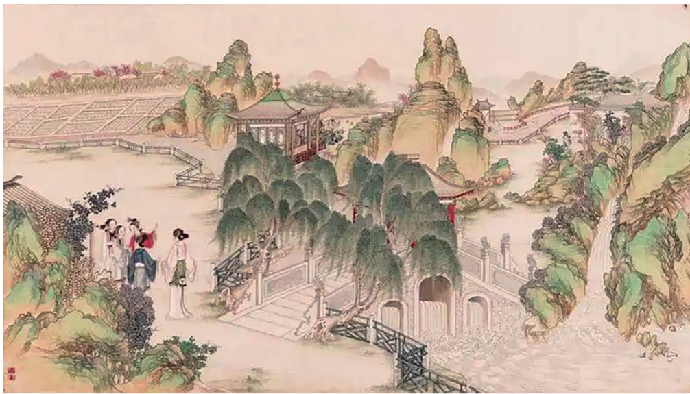
▲清代孙温绘制的《全本红楼梦图》选图(旅顺博物馆馆藏)