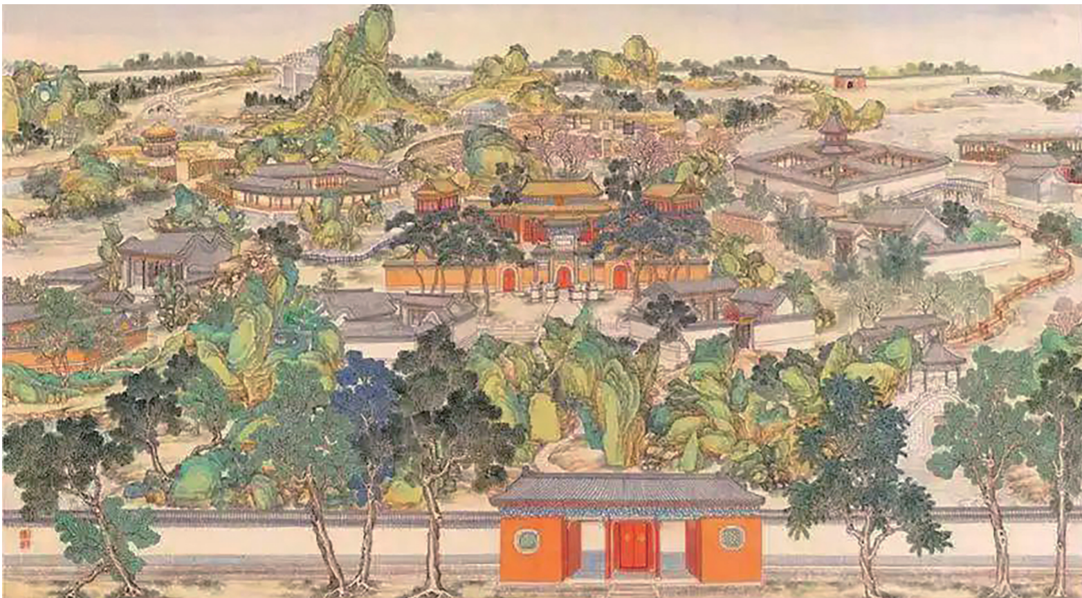
▲清代孙温绘制的《全本红楼梦图》中的大观园(旅顺博物馆馆藏)