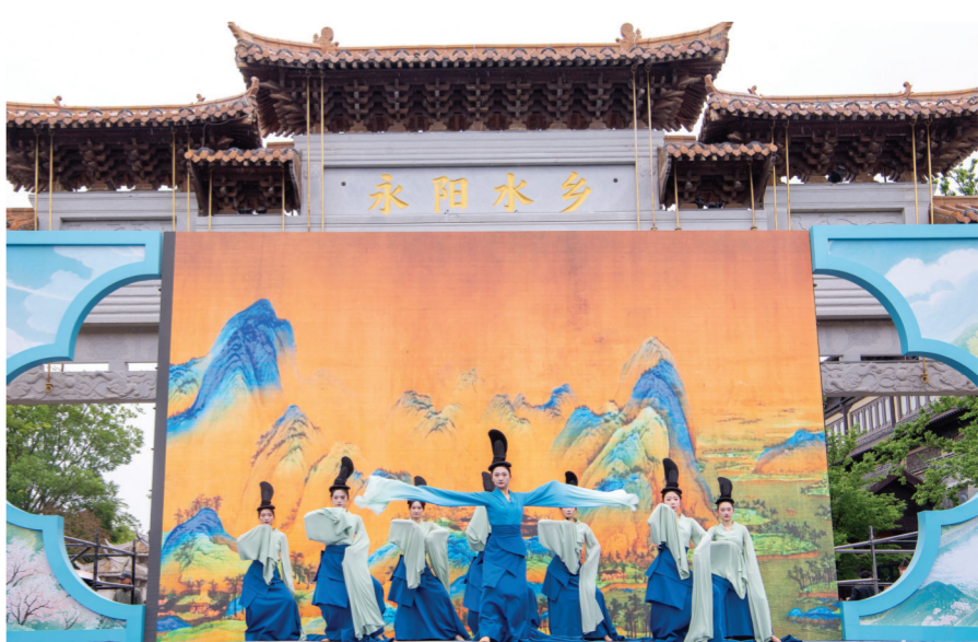
开街仪式上表演舞蹈《云深不知处》。

据悉,4月28日至5月5日,兴茂水镇将持续推出武侠主题演出、打卡集章兑礼、专属权益礼包等八大亮点活动,联动多元业态释放消费潜力,助力文旅产业高质量发展。