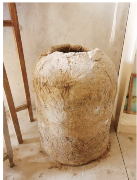
▲天长大通民俗小院收藏的泥瓮。

帚打我母亲。原因是我家屋漏,雨水浸湿了他的泥瓮。泥瓮最怕受潮,一受潮,不仅里面粮食会霉变,自身还会坍塌。老外公发火,是责怪我母亲不管事,不会持家过日子。天晴日,老外公就从乡下背了两捆稻草来,他捣毁了受潮的泥瓮,一边将稻谷弄出来晾晒,一边着手盘新的泥瓮。我父亲和我母亲,忙不迭上井台打水,帮着挖泥、和泥。