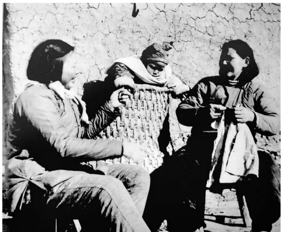
▲1967年,天长县关塘公社庵晏大队妇女带娃生活场景。