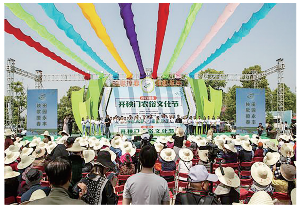
▲皖东开秧门农俗文化节。(资料图)

如今,时代发展,历史变迁,很多传统农耕用具、生活老物件,都从人们的视线消失了。时下很多地方在打造美丽乡村,为留住乡愁,传承历史,都相继建了村史馆,我曾先后参观过几个,但遗憾的是,在陈列的诸多老物件中,我始终未能见到背篷。