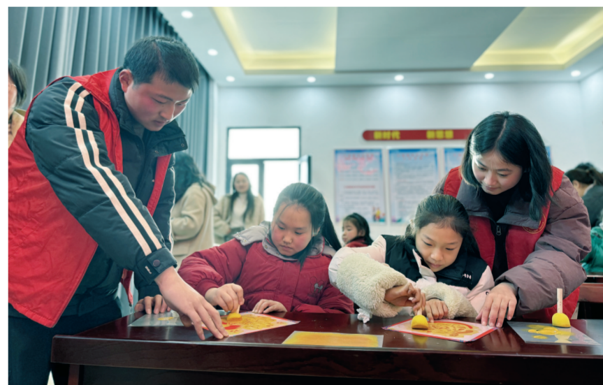
志愿者指导孩子们学习拓印技艺。

本报讯 为传承中华优秀传统文化，增强青少年文化认同感，日前，来安三城镇组织开展“非遗贺新春 童印吉祥年”主题活动，多名志愿者参与活动，与辖区青少年一同以拓印技艺制作马年主题日历，感受非遗魅力。