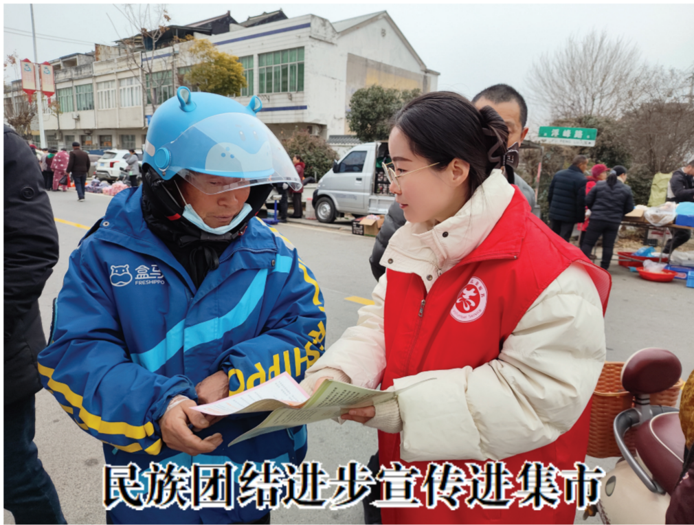
民族团结进步宣传进集市

近日,天长市那集镇党委统战部门组织工作人员,深入辖区集市开展民族团结进步宣传教育活动,把民族政策与和谐理念送到群众心坎上。工作人员走到水果摊、小吃铺前,一边递上宣传页,一边用方言唠家常,借着集市上各族群众互帮互助的日常小事,把民族政策讲得明白白。