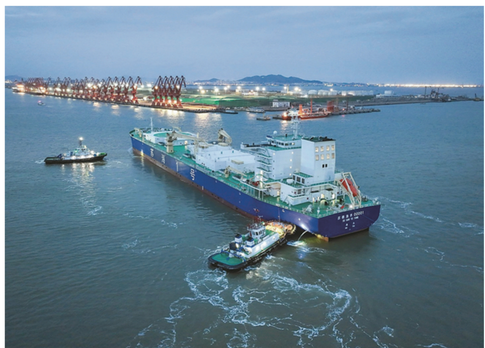
三文鱼养殖工船“苏海1号”。