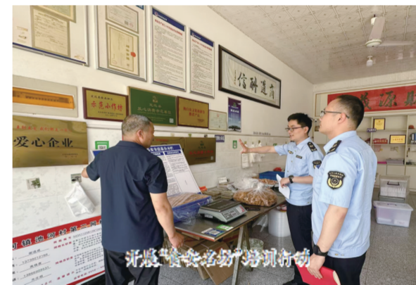
开展“食安名坊”培育行动

解决城市住宅小区的遗留问题，是居民群众高度关注、热切期盼的惠民暖心工程。定远县积极响应民需，稳步推进城镇老旧小区改造工作，按计划推进改造任务落地见效；强化老旧小区物业管理，新增电动自行车充电端口2080个，破解居民充电难题；完成屋面渗漏、外墙脱落维修5740平方米，让小区颜值与居住舒适度双提升；推进住宅小区电梯更新改造项目，通过设施升级筑牢居民出行安全防线。除了老旧小区改造，定远县还积极实施便民停车行动。通过合理规划与建设，新增城市停车位2986个，其中公共停车位842个，有效缓解了城市停车难的问题，让居民出行更加便捷。