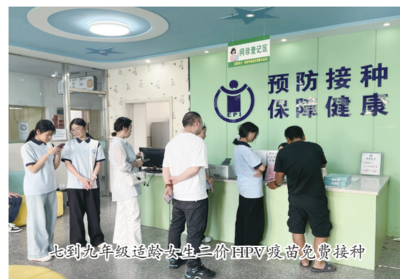
七到九年级适龄女生三价HPV疫苗免费接种

“没有全民健康，就没有全面小康。”“十四五”以来，定远县认真落实健康优先发展战略和健康中国战略，聚焦“健康滁州”建设精准施策、多措并举。实施健康口腔行动成效显著，今年累计为3242名儿童窝沟封闭、8397名儿童涂氟，守护儿童口腔健康；推进出生缺陷防治提升行动，新生儿疾病筛查率达98.88%，听力筛查率达99.4%，均高于既定目标，为新生儿健康筑牢防线；强化女性“两癌”防治，设23个接种点，为3988名适龄女生免费接种，同时完成21882人宫颈癌筛查TCT采样、2771人乳腺癌初筛，全方位呵护女性健康。