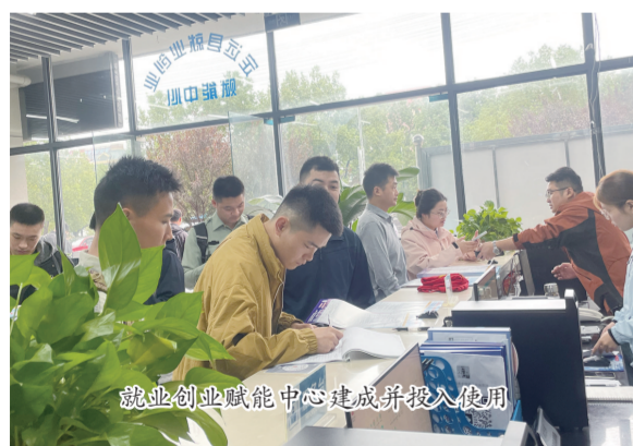
就业创业赋能中心建成并投入使用

就业是最基本的民生，牵动着千家万户的生活，事关经济社会健康发展。定远县聚焦就业服务提质增效，多措并举拓宽就业渠道，助力重点人群就业。持续推进“三公里”就业圈建设，布局零工市场、县级赋能中心与就业驿站，通过实地走访、电话联系等方式对接企业，收集用工岗位4000余个；创新推出“夜市招聘+直播带岗”模式，开展专项招聘活动，累计吸引9.2万人次线上参与，2400余人加入求职者微信群，精准提升人岗匹配效率；同步实施重点人群就业促进行动，落实毕业生求职补贴发放办法，今年以来，该县已拨付补贴3.75万元；开展放心家政行动，培训家政服务人员2210人次，新增从业人员1107人，全方位夯实就业保障。