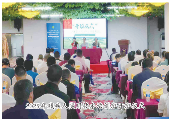
2025年残疾人实用技术培训开班仪式