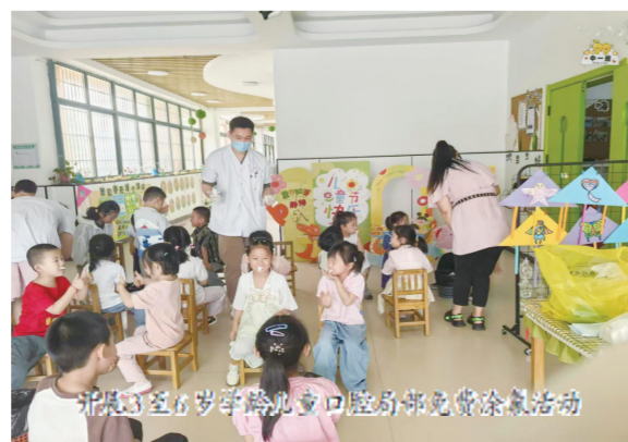
开展5至6岁学龄儿童口腔预防涂氟活动

百年大计，教育为先，教育是最大的民生。定远县扎实推进教室光环境改造工作，为学生打造明亮舒适的学习空间；开展中小学生阳光体育促进行动，义务教育阶段学校每日1节体育课、上下午各30分钟大课间，保障学生每日2小时体育活动，释放青春活力；实施老有所学行动，新增老年学员1.194万人，参与学习老年人达5.658万人，让各年龄段人群均能共享发展成果、感受民生温度。