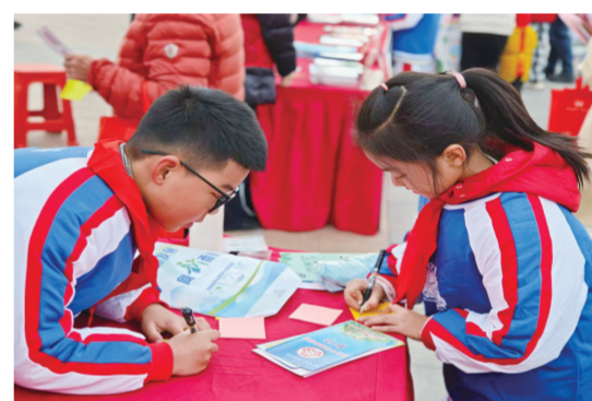
学生们体验趣味活动