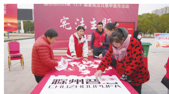
参展群众体验法治拼图