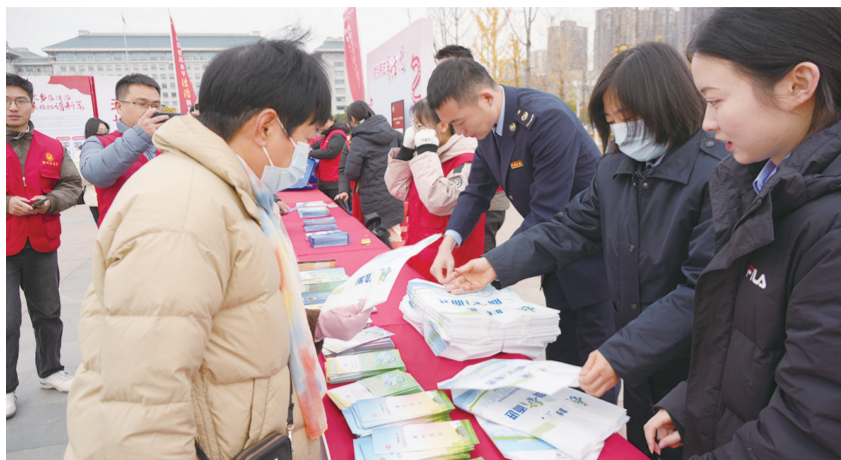
工作人员讲解典型案例