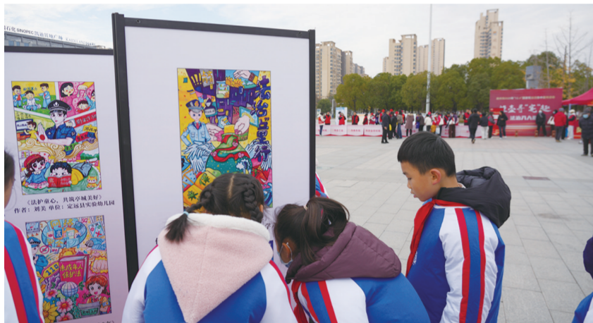
学生们欣赏获奖作品

为深入学习宣传贯彻习近平法治思想,推动宪法精神入脑入心,12月4日上午,滁州市在农歌会广场举办2025年“12·4”国家宪法日集中宣传活动。市直单位党员干部、青少年学生、志愿者、社区群众及媒体代表等约500人参加活动。