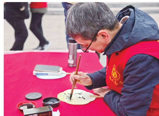
书法协会志愿者绘制漆扇