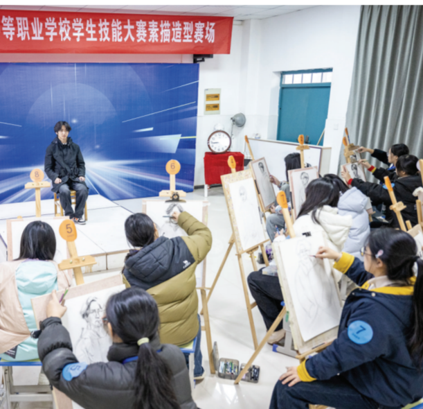
▲图为学生在进行素描造型项目比赛。