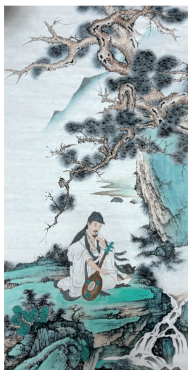
▲古画临摹《松荫抚阮图》