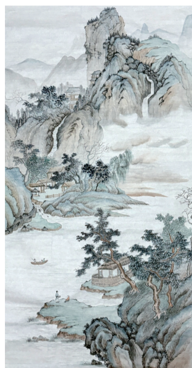
▲古画临摹《烟峦幽隐图》