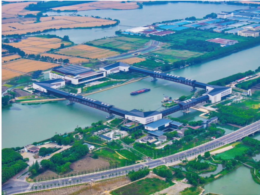
长三角生态绿色一体化示范区重大项目方厅水院竣工。

长久以来,省际交界地区发展滞后的情况普遍存在,生产要素很难汇聚于此。如今,长三角一体化示范区正由形态开发转向功能塑造。打破城市边界无法发展的“魔咒”,也许,就从矗立在长三角“原点”的方厅水院开始。