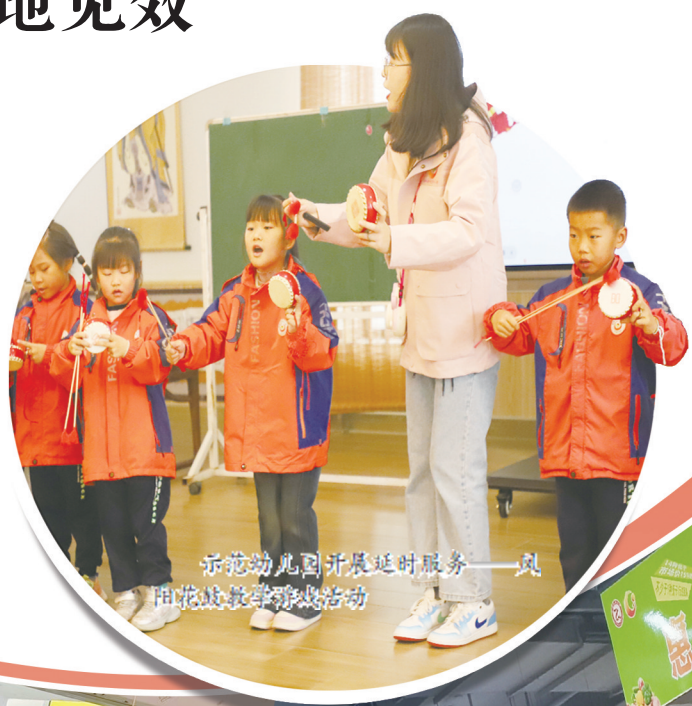
示范幼儿园开展延时服务——凤阳县幼教集团

民有所思,我有所动;民有所愿,我有所为。近年来,凤阳县始终把“让人民过上幸福生活”作为头等大事,紧紧抓住群众最关心、最直接、最现实的利益问题,采取一系列惠民生、暖民心的举措,不断成就家家户户的“小愿景”、实现老老少少的“新期盼”,让一份份沉甸甸的民生账单持续“加码”,托起了群众“稳稳的幸福”。