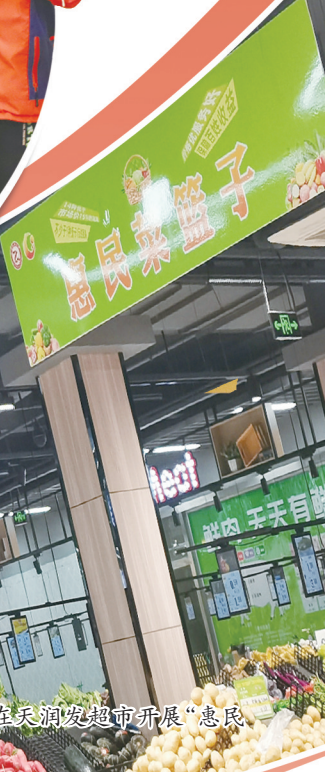
县发改委在天润发超市开展“惠民菜篮子”活动