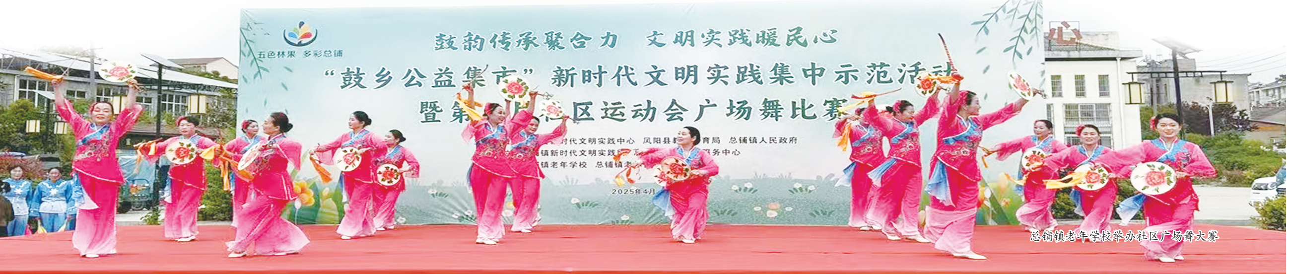
总铺镇老年学校举办社区广场舞大赛

一件件民生实事的落地,一声声群众满意的称赞,见证着凤阳县民生工作的扎实足迹。未来,凤阳县将继续以群众需求为导向,以实干担当为底色,持续推动民生实事走深走实,让群众的幸福底色更浓厚、幸福指数再提升。