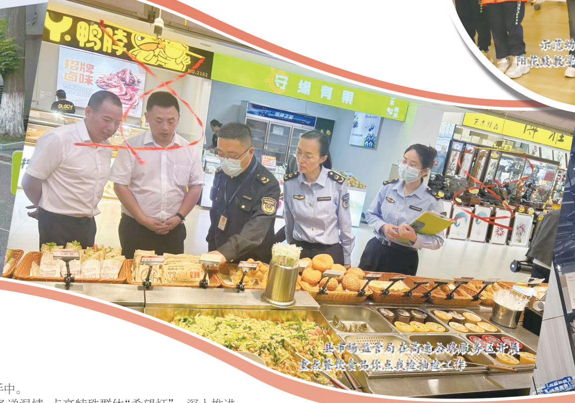
县市场监管局在高铁合路服务区开展“惠民菜篮子”活动