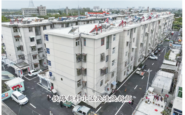
铁路新村小区改造焕新颜

共同体,并建立系统完备、操作性强的流程。同时,加大专项资金投入,积极争取上级补助与专项债券,确保资金精准使用。此外,健全老旧小区物业服务兜底机制,指导创新管理方式,提升物业管理水平;加强改造后小区管理,建立党建引领、多方共治的物业管理体制,提高服务品质。截至9月底,共推动住宅小区新增电动自行车充电端口950个,实施住宅小区屋面渗漏和外墙脱落维修3万平方米。