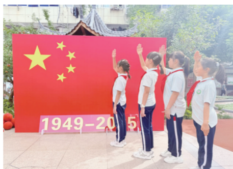
学生们与国旗同框合影

从“让信仰的种子在心中生根发芽”到“让奉献精神照亮成长的道路”，学生代表号召全体同学“以梦为马，不负韶华”，争做有理想、有本领、有担当的新时代好少年，展现了当代青少年的责任与担当。最后，活动在全椒县实验小学原创歌曲《红旗飘扬 五星闪亮》中落下帷幕。