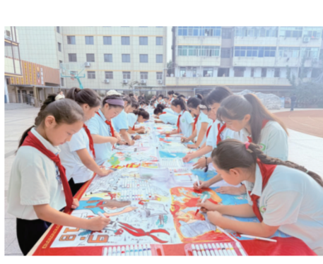
“绘我中华”二十米长卷现场绘画

除了主题展演，活动现场还设置了“我与国旗同框”主题拍照区、“绘我中华”二十米长卷现场绘画和“我的强国梦想”心愿投递站等互动环节，同学们踊跃参与，争相与国旗合影，用五彩画笔描绘自己眼中的祖国，并写下对祖国的美好祝愿。“我要当一名科学家，为祖国造最先进的飞船”“祝愿祖国更加繁荣富强”……真挚的话语，承载着孩子们对祖国未来的美好憧憬。