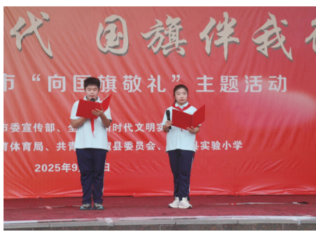
学生代表现场倡议

舞台上，小演员们化身“星星之火”，通过队形变换与情感表达，寓意革命火种从微弱到燎原之势的伟大历程，展现了新时代少年儿童心向党、奋发向上的精神风貌。