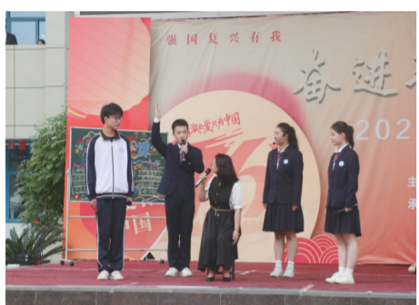
朗诵《培根铸魂，高峰颂》

活动现场，红旗招展，气氛庄严。伴随着激昂的《歌唱祖国》合唱表演，活动正式拉开序幕。随后，全体人员肃立，举行庄严的升旗仪式，鲜艳的五星红旗冉冉升起，全体人员高唱国歌，向伟大祖国致以最崇高的敬意。