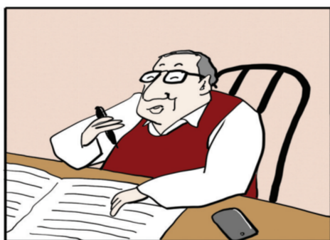
我生活中充满了疑问,都得我自己去找寻解答。