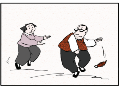
没完没了的抱怨得不到同情。