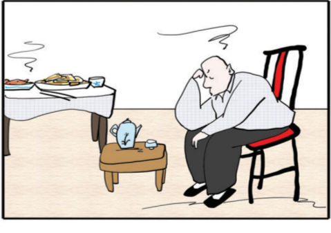
切莫垂头丧气,即使失去了一切,你还握有未来。