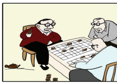
有很多良友,胜于有很多财富。