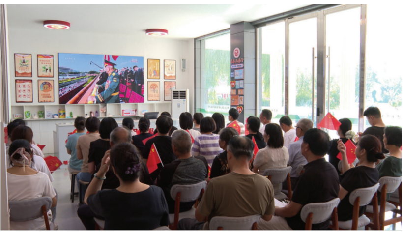
明光街道花园社区干部群众收看九三阅兵式。