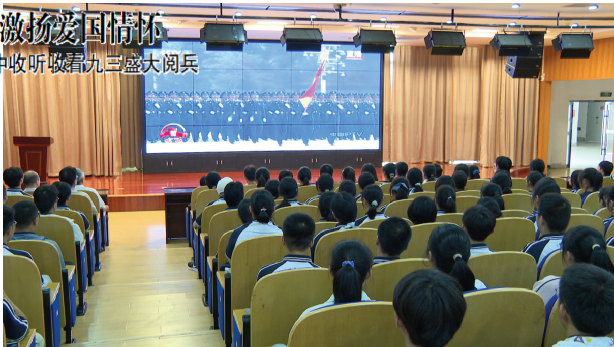
明光中学师生共同观看阅兵式直播。