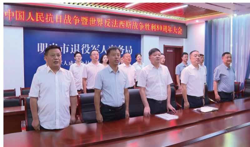
明光市退役军人事务局组织观看阅兵式,齐声高唱国歌。