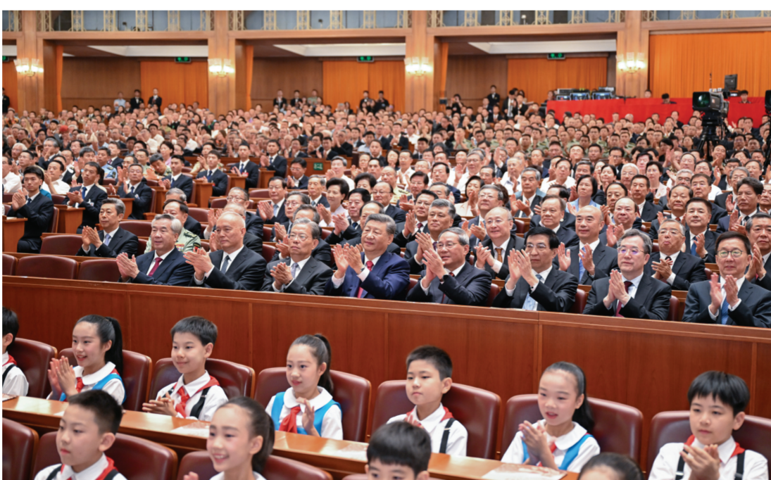
9月3日,纪念中国人民抗日战争暨世界反法西斯战争胜利80周年文艺晚会《正义必胜》在北京人民大会堂隆重举行。习近平、李强、赵乐际、王沪宁、蔡奇、丁薛祥、李希、韩正等党和国家领导人,与约6000名中外人士一起观看晚会。

第一场“怒吼吧,黄河”中,情境表演《中华民族到了最危险的时候》、情境歌舞《血染的白桦林》、舞蹈《殇》悲壮沉痛,朗诵与合唱《怒吼吧,黄河》慷慨激昂,表现了在中国共产党号召和领导下,中国人民奋起反抗侵略者的英勇无畏。第二场“红星照耀中国”中,情境诗朗诵《这束光》、歌舞《延安!延安!》激情洋溢,情境表演《窑洞与战壕》感人至深,展现了中国共产党高举抗战旗帜,成为全民族抗战的中流砥柱。第三场“不可战胜的力量”中,组舞与组歌《遍地烽火》、情境戏剧《永远的番号》和男子群舞《血战到底》气吞山河,彰显了党领导的人民战争的磅礴力量。第四场“共同的黎明”中,舞蹈《乘风》、情境演唱《不朽的旋律》、歌曲《无名者勋章》凝重深情,讴歌了中国人民以巨大牺牲支撑起世界反法西斯战争东方主战场,为世界反法西斯战争胜利作出的历史贡献。第五场“正义永恒”中,情境对话《如你所愿》情感真挚,仪式仗仗表演《守护正义》、领唱与合唱《势不可挡》将演出推向高潮,描绘了新时代中国的壮阔气象,昭示正义必胜的真理力量。尾声环节,歌舞