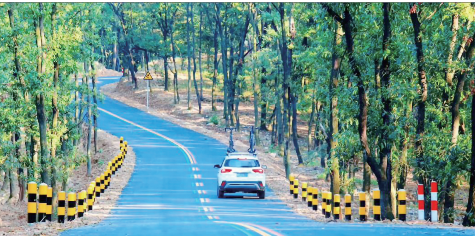
▲定远岱山的山间公路