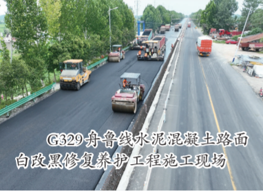
G329舟鲁线水泥混凝土路面白改黑修复养护工程施工现场

作为滁州市普通国省道网络的重要组成部分,G329舟鲁线连接凤阳县五里庙至官塘,全长7.99公里,是支撑县域经济循环的关键动脉。该路段2014年建成通车后,因长期承担重交通荷载,水泥砼路面出现破碎板、板角断裂等病害,亟需改造升级。