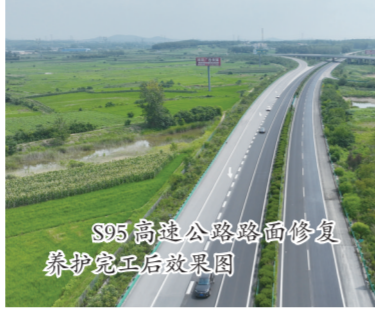
S95高速公路路面修复养护完工后效果图