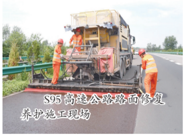
S95凤阳支线公路路面修复养护施工现场

作为滁州高速公路养护工程的示范项目,完工后将实现“三个提升”:通行时速恢复至120公里服务标准,服务区与互通收费站联动效率提高30%,应急保通响应时间缩短至30分钟内,为凤阳经开区与蚌埠、淮南等地的产业协同提供高效交通保障。