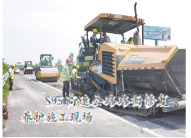
S95凤阳支线公路路面修复养护施工现场

依据国评“养护工程应完尽完”标准,此次养护工程投资1900余万元,实施精准处治。目前工程已完成99%,通过科学养护,路面抗滑性能提升40%,水损风险降低60%,将有效延长公路使用寿命。