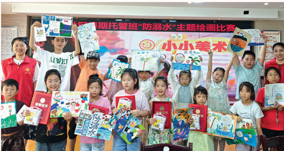
暑期托管班“防溺水”主题绘画比赛