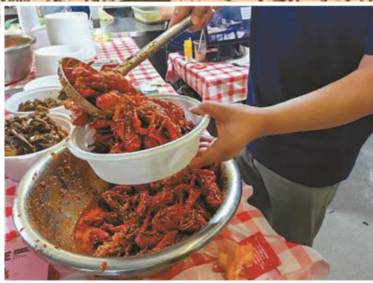
▲合肥龙虾节现场香气弥漫。

翻开长三角小龙虾消费市场历史，在蚌埠面前，盱眙只能算是后起之秀。纪录片《虾街十年》完整记录了1997—2007年期间，安徽蚌埠市南山路口蚂虾街的小龙虾故事。这部纪录片让全国人民了解到，在时间线上，蚌埠才是带火小龙虾餐饮市场的第一城。