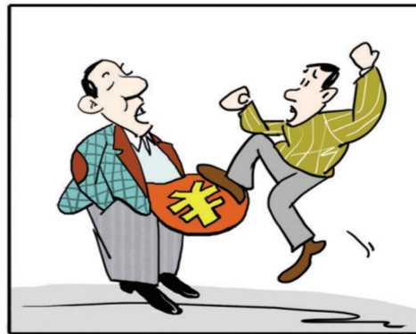
有钱的,“口气”很大;没钱的,“火气”很大。