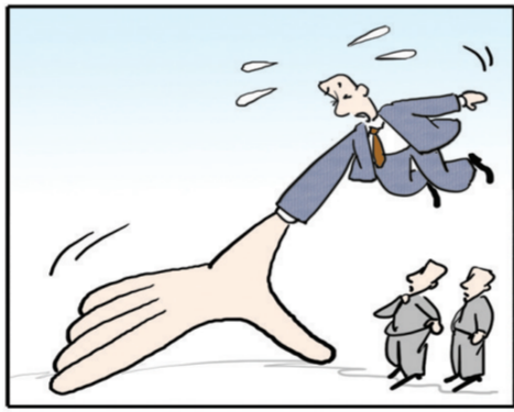
贫者希望得到一些东西,奢者希望得到许多东西,贪者希望的到一切东西。