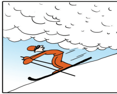
雪崩时,没有一片雪花觉得自己有责任。