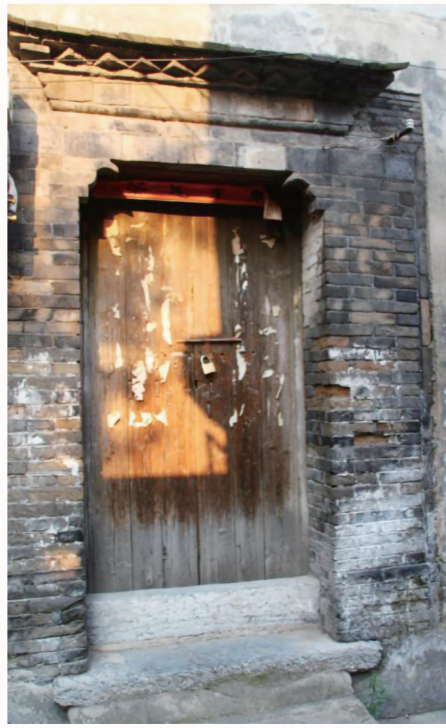
▲“江源泰”通向金刚巷的后门