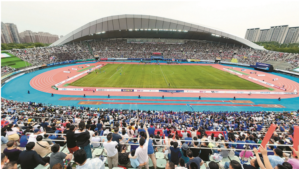
6月14日,“苏超”第四轮扬州队主场与泰州队鏖战,现场涌入2万名观众。