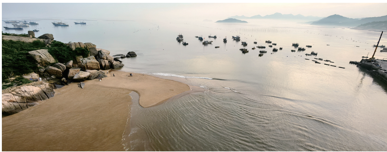
▲大海边,沙滩上(摄影)