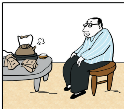
一种美好的心情,比十副良药更能解除生理上的疲惫和痛楚。