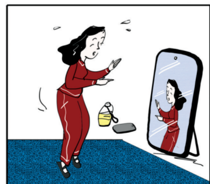
运动可使整个有机体得到自然的和谐的发展。