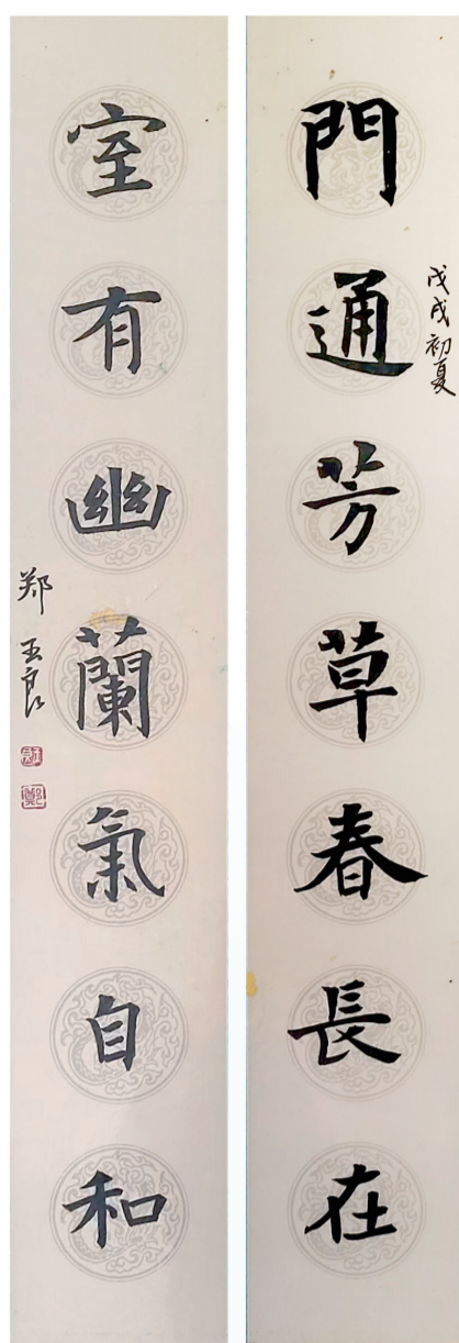
▲楷书 门通芳草春长在 室有幽兰气自和

飞、辛弃疾、文天祥等古代先贤忠心爱国的励志故事,教孩子们熟背唐诗宋词,讲解中还穿插着天文地理、军事、文学艺术、典故和生活常识,将文化与历史融汇贯通,深入浅出,每节课讲一点点,润物无声、循序渐进,进一步引导孩子们的志向,激发他们的兴趣。他的家也俨然成了“文艺百科大讲堂”。家长们和成人求学者对此教育模式非常认同,孩子们学起来轻松、乐此不疲。 人生风景多绚丽,繁荣文化作先锋。愿郑玉良夫妇这对提携后生的导师,充满人格魅力的热心人,“壮心未与年俱老”,不忘初心,行稳致远,在文化传承事业上谱写出人生更辉煌的篇章!