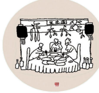
有钱的时候在酒店吃野菜