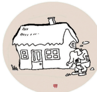
没钱的时候想结婚