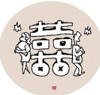
有钱的时候想离婚