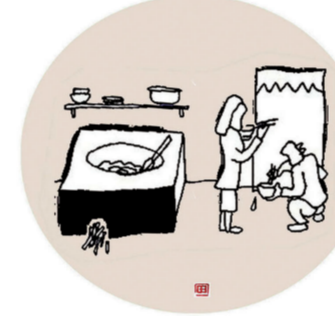
没钱的时候在家里吃野菜