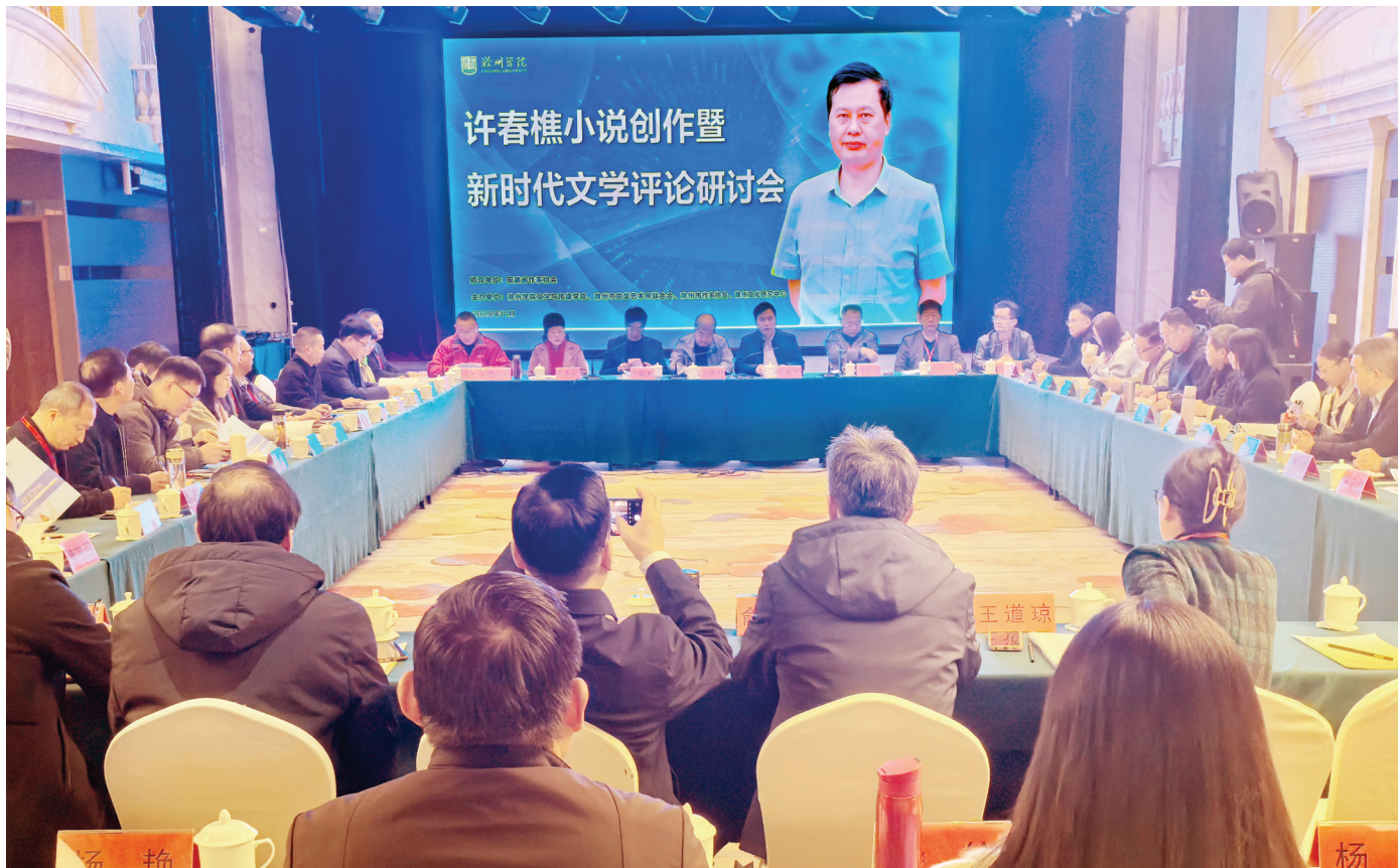
▲研讨会现场。