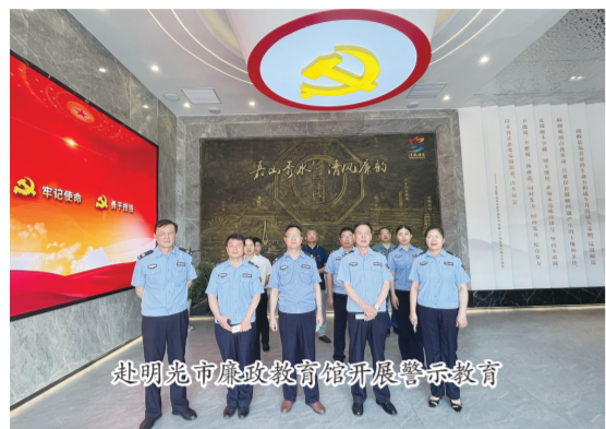
赴明光市廉政教育馆开展警示教育