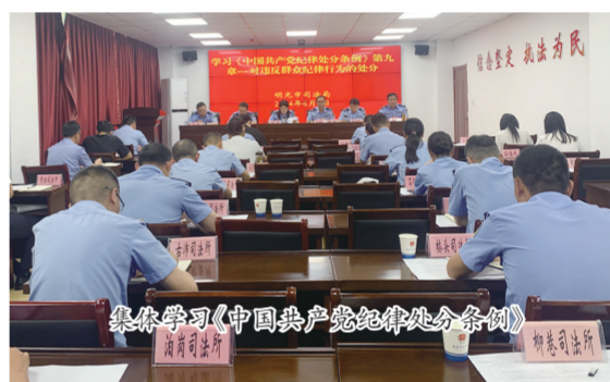
集中学习《中国共产党纪律处分条例》

回眸往昔，初心凝聚力量；展望未来，使命催人奋进。踏上新的征程，明光市司法局将突出政治建设和专业能力建设，以统抓协调全面依法治市工作落实、严格规范执法、创优法治环境、促进社会稳定，努力交出一份司法行政工作高分答卷。