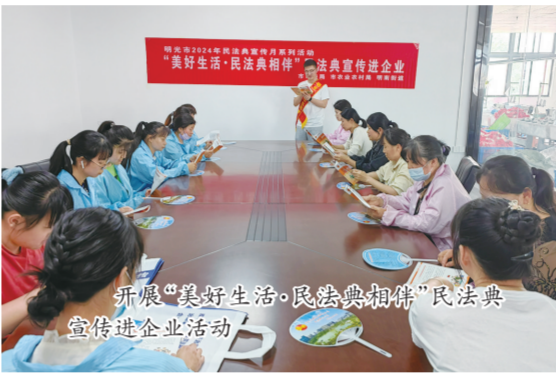
开展“美好生活·民法相伴”民法典宣传进企业活动