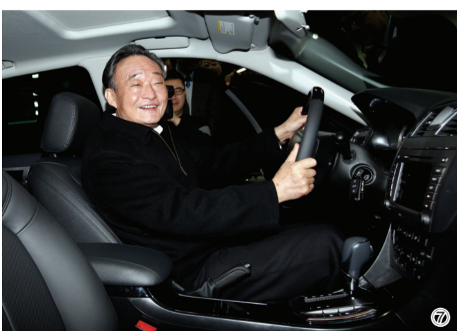
图⑦:2010年1月30日,吴邦国同志在上海汽车集团股份有限公司技术中心察看新能源样车。