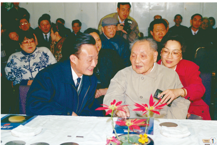
图①:1992年2月10日,邓小平同志在上海贝岭微电子制造有限公司参观时与吴邦国同志交谈。