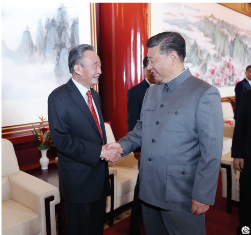
图②:2021年7月1日,庆祝中国共产党成立100周年大会在北京天安门广场隆重举行。这是庆祝大会前,习近平同志与吴邦国同志握手。