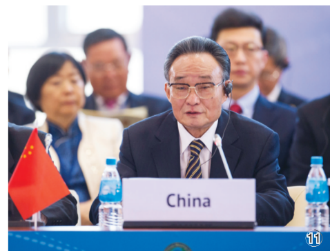
图⑪:2013年1月28日,吴邦国同志在俄罗斯符拉迪沃斯托克出席亚太会议论坛第21届年会,并作题为《坚持和平发展 促进合作共赢》的主旨发言。