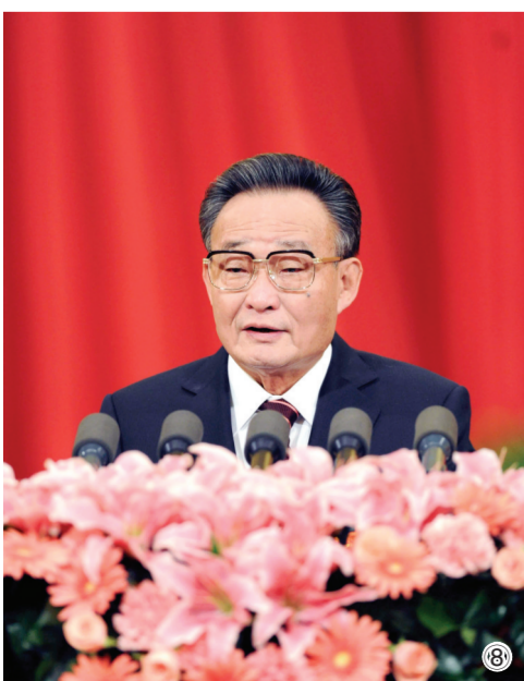
图⑧:2011年3月10日,十一届全国人大四次会议在北京人民大会堂举行第二次全体会议。吴邦国同志作全国人民代表大会常务委员会工作报告。