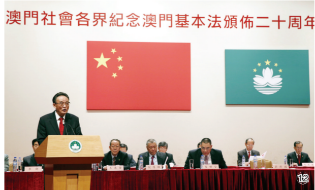
图⑫:2013年2月21日,吴邦国同志在澳门文化中心出席澳门社会各界纪念澳门基本法颁布20周年启动大会并发表讲话。