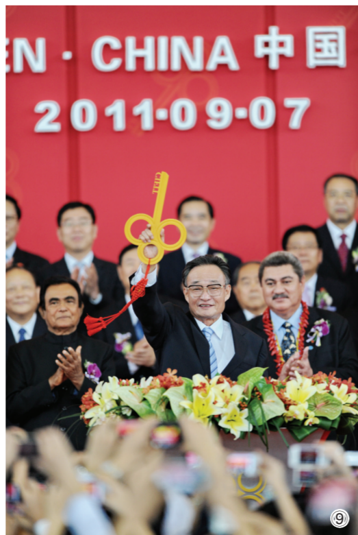
图⑨:2011年9月7日,吴邦国同志在福建厦门出席第十五届中国国际投资贸易洽谈会开幕式。