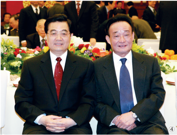
图④:2005年1月1日,全国政协在北京举行新年茶话会。这是胡锦涛同志与吴邦国同志在一起。