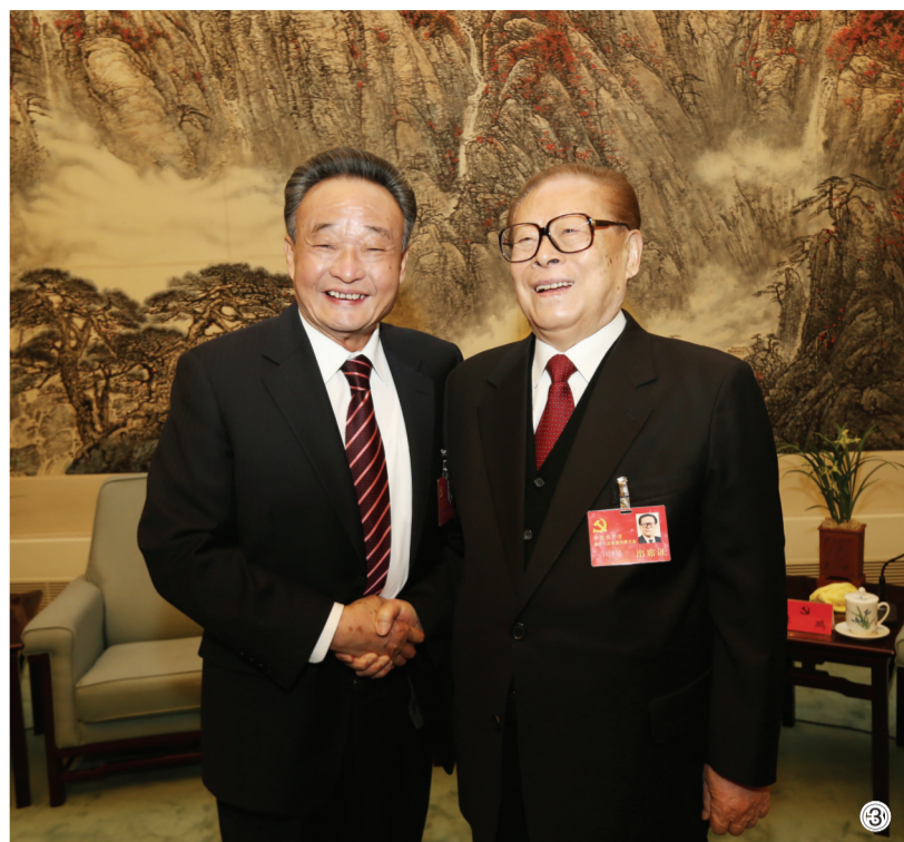
图③:2012年11月14日,中国共产党第十八次全国代表大会在北京闭幕。这是闭幕会前,江泽民同志与吴邦国同志在一起。