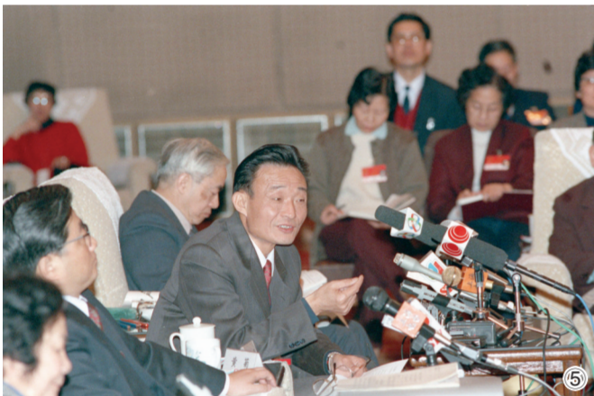
图⑤:1994年3月,时任上海市委书记的吴邦国同志在全国两会上海代表团全团会议上。