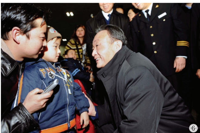
图⑥:2008年2月3日,吴邦国同志在北京西站候车室与旅客交谈。