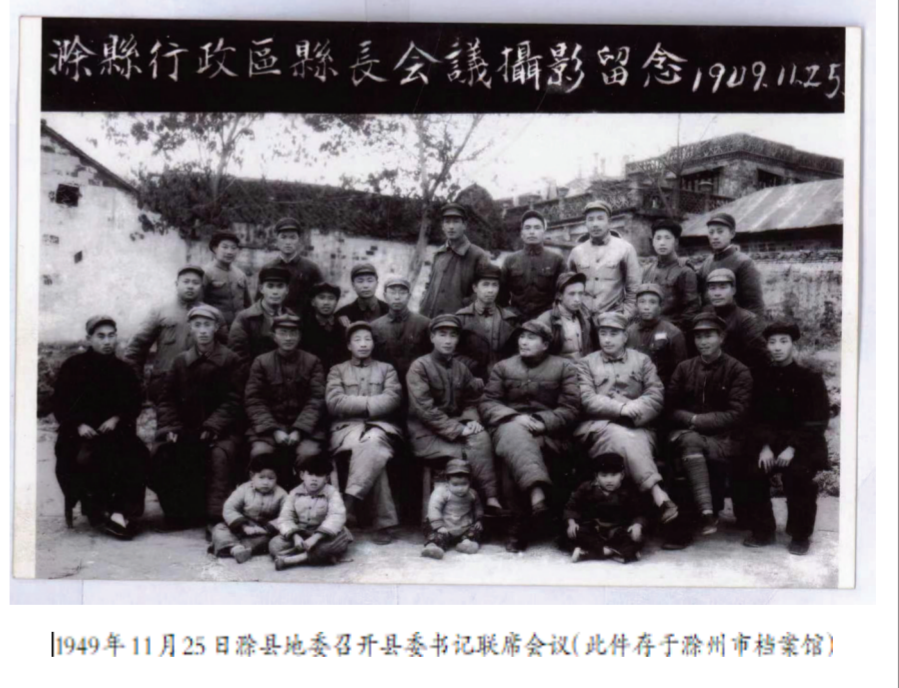
1949年11月25日滁县地委召开县委书记联席会议(此件存于滁州市档案馆)