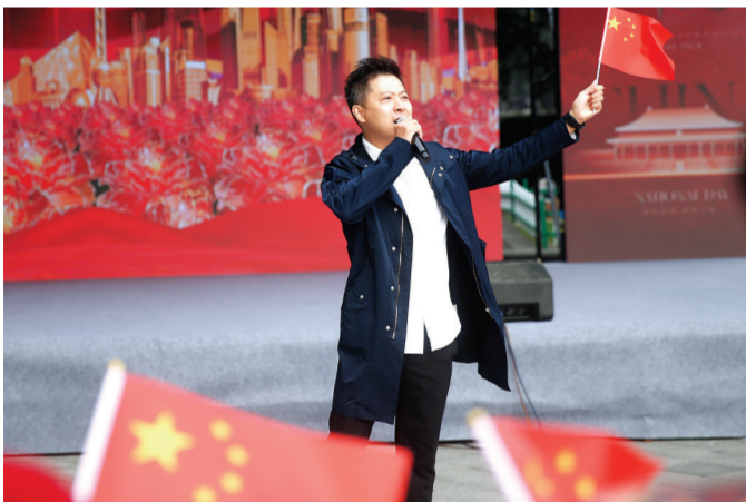
▲图为红歌“快闪”演唱活动现场。