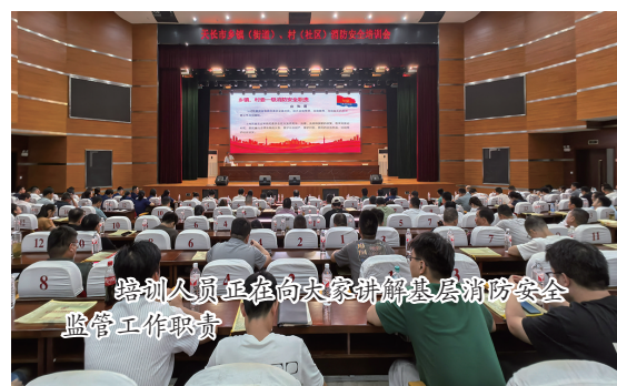
培训人员在向参训人员讲解基层消防安全监管工作职责

随着经济的飞速发展和城市化进程的不断加快，基层消防安全面临着前所未有的挑战。为进一步提升基层消防安全自我管理能力和水平，连日来，滁州市消防安全委员会组织开展了2024年基层消防安全大培训，着力培养了一批消防安全“明白人”、基层消防工作“带头人”。