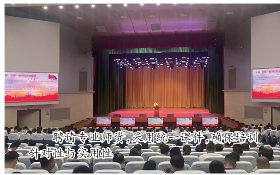
聘请专业师资，采用统一教材，确保培训内容针对性实用性