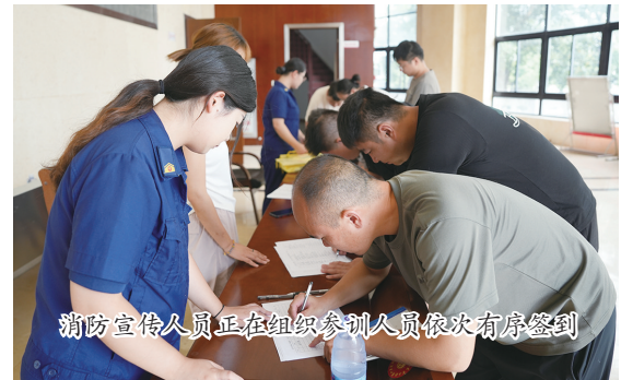
消防宣传人员正在组织参训人员依次有序签到

“这次培训使我充分认识到了肩负的重要职责和使命，也更加体会到了提升消防监管能力的紧迫性，为我们今后开展乡镇消防安全管理工作指明了方向、厘清了思路。”培训结束后，一名参加培训的基层工作