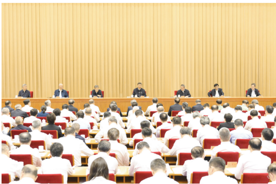
9月9日至10日,全国教育大会在北京召开。中共中央总书记、国家主席、中央军委主席习近平出席会议并发表重要讲话。李强、赵乐际、王沪宁、蔡奇、丁薛祥、李希出席会议。

力、科技支撑力、民生保障力、社会协同力、国际影响力,为以中国式现代化全面推进强国建设、民族复兴伟业提供有力支撑。