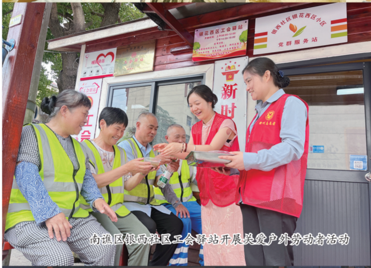
南谯区银西社区工会服务站开展关爱户外劳动者活动