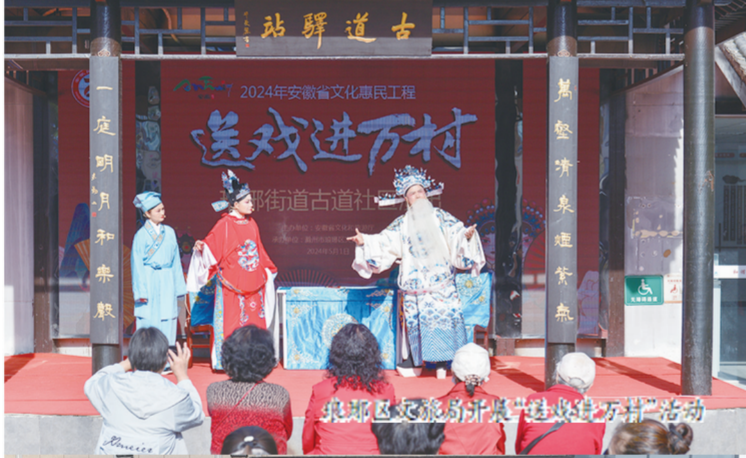
琅琊区定远路开展“送戏进万村”活动