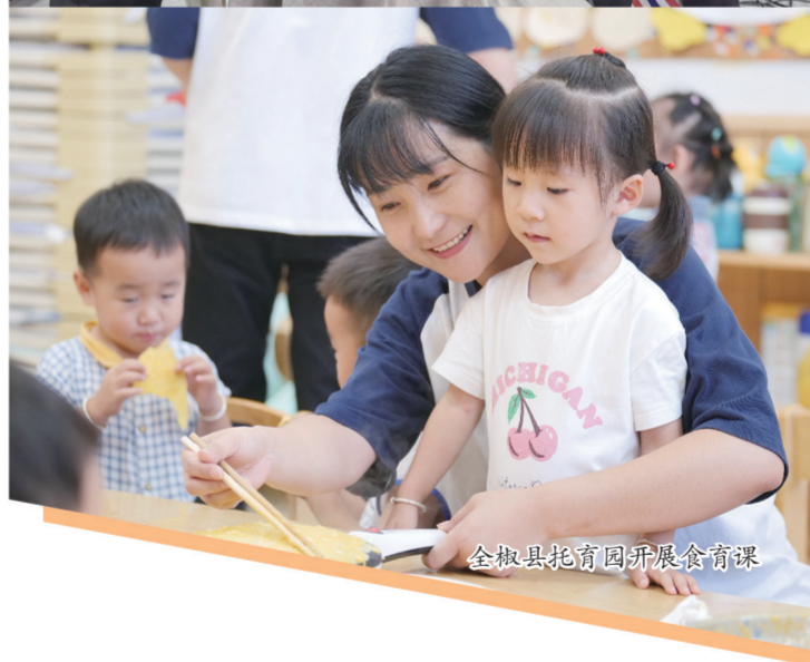
全椒县托育园开展食育课