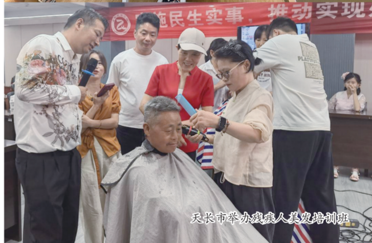
天长市举办残疾人美发培训班