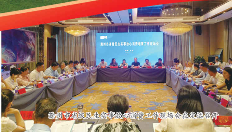
滁州市省级民生实事放心消费工作现场会在定远召开

展望未来，站在时代的新起点上，市民生办将按照市委、市政府要求，在市人大监督下，严格落实周调度、月通报、季督查机制，继续坚持以人民为中心的发展思想，聚焦群众关切，不断创新工作思路和方法，努力推动更多民生实事落地见效，为构建幸福美好家园书写民生崭新篇章。