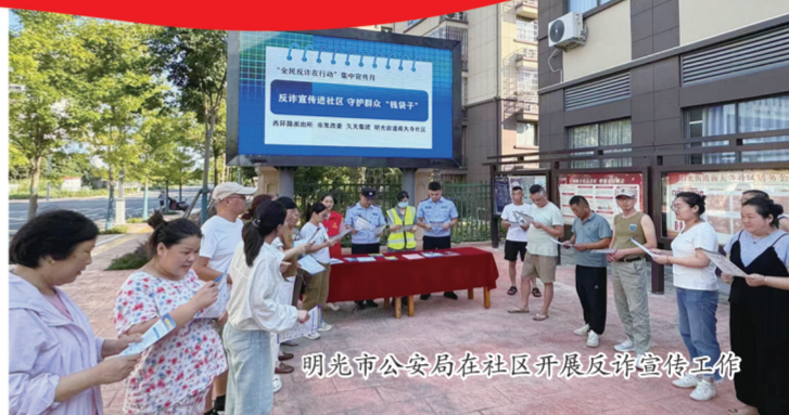
明光市公安局在社区开展反诈宣传工作