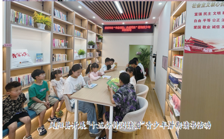
凤阳县开展“十五分钟阅读圈”青少年暑期阅读活动