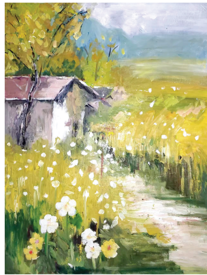
▲《村口》(油画) 作者:杨雨晴(美术教育) 指导老师:刘念

毕业创作(设计)作品展不仅为学生们提供了一个展示才华的舞台,也让他们更加深入地理解了美的内涵和价值。学生们通过创作一系列作品,来展示新时代生活的点点滴滴以及对美好生活的憧憬和向往。