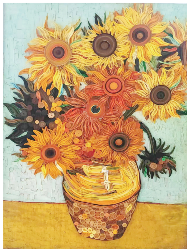
▲《向日葵》(综合材料) 作者:王一君(美术教育) 指导老师:王荣荣