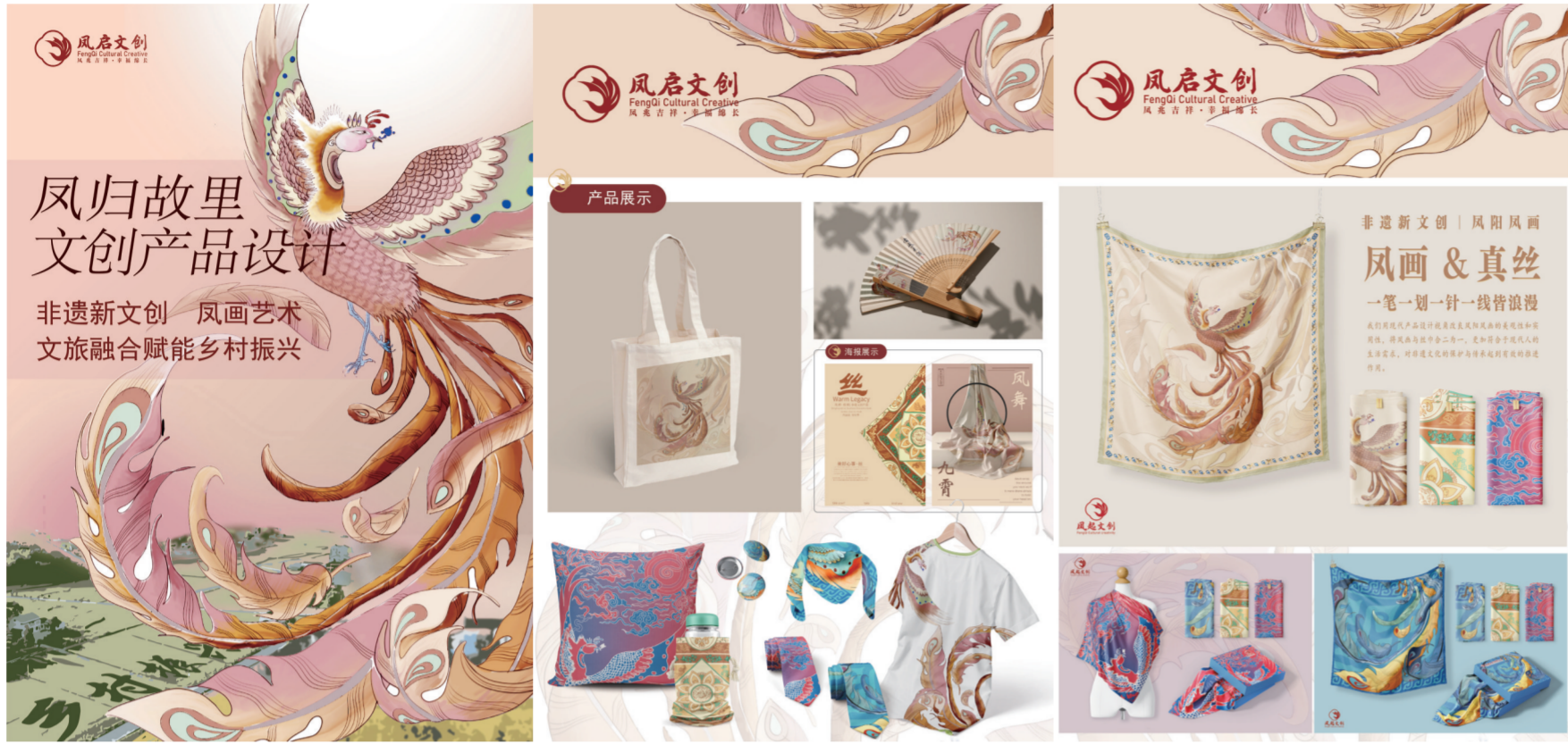
▲《凤归故里》(文创产品) 作者:胡倩倩(艺术设计) 指导老师:申佳美子 刘晓玲