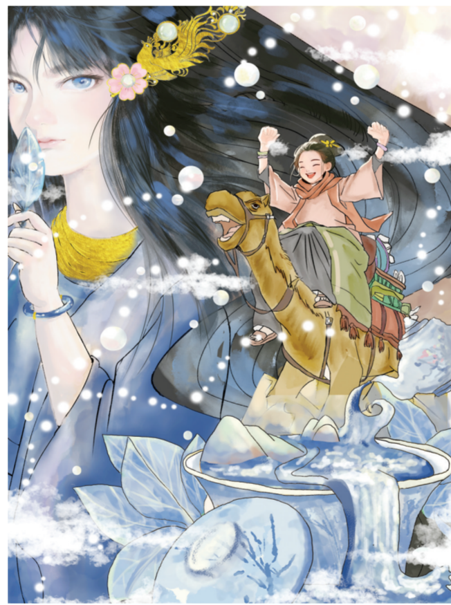
▲《朗朗神州 漫漫丝路》(插画) 作者:武暖心(艺术设计) 指导老师:申佳美子