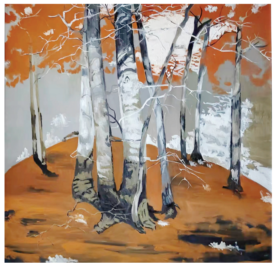
▲《秋日树林》(油画) 作者:秦锦锦(美术教育) 指导老师:刘念