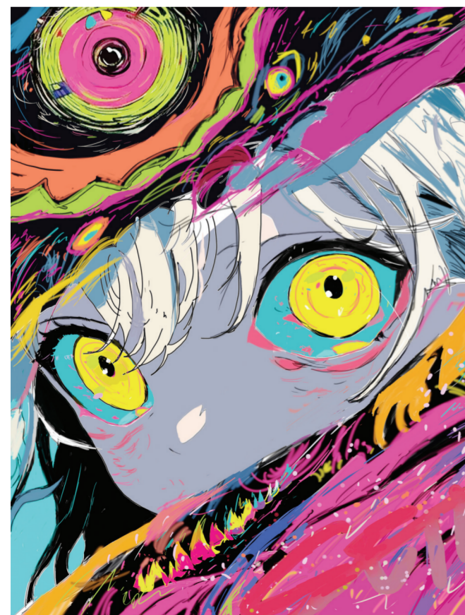
▲《凝视》(插画) 作者:周顺(艺术设计) 指导老师:樊瑾 陈穆