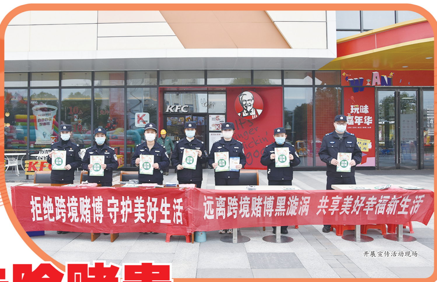
开展宣传活动现场