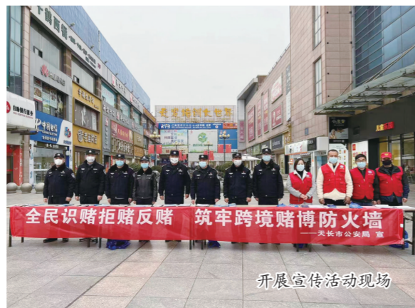
开展宣传活动现场

不仅要打，更要严防。市公安局在取得显著战果的同时，深刻认识到打击赌博犯罪的长期性和复杂性。为了巩固打击成果，防止赌博犯罪反弹，警方继续保持高压态势，加强巡逻防控和线索摸排工作。