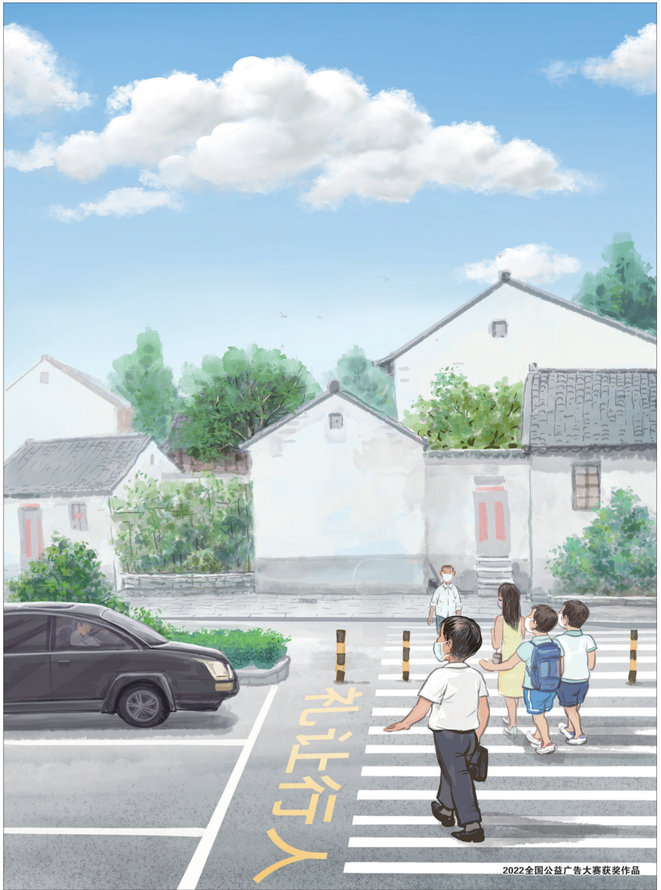
2022全国公益广告大赛获奖作品