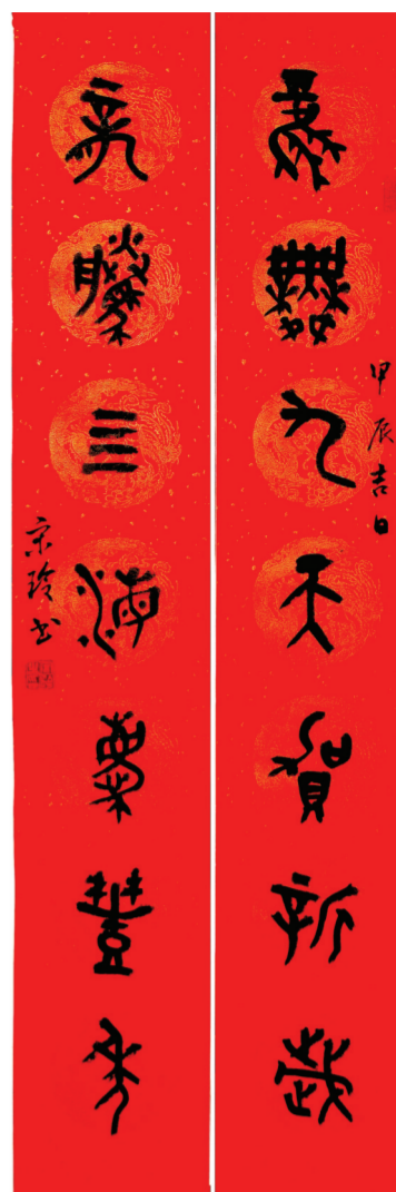
▲篆书 宋玲书 (龙腾九天贺新岁,龙腾四海庆丰年。)