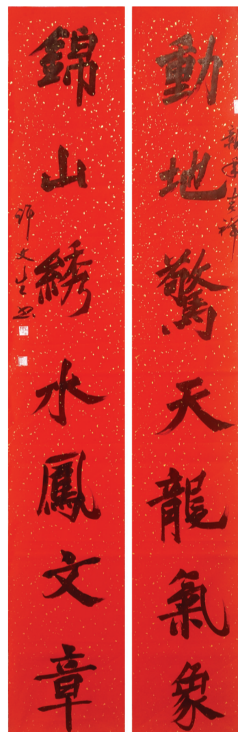
▲楷书 许文生书 (动地惊天龙气象,锦山绣水凤文章。)