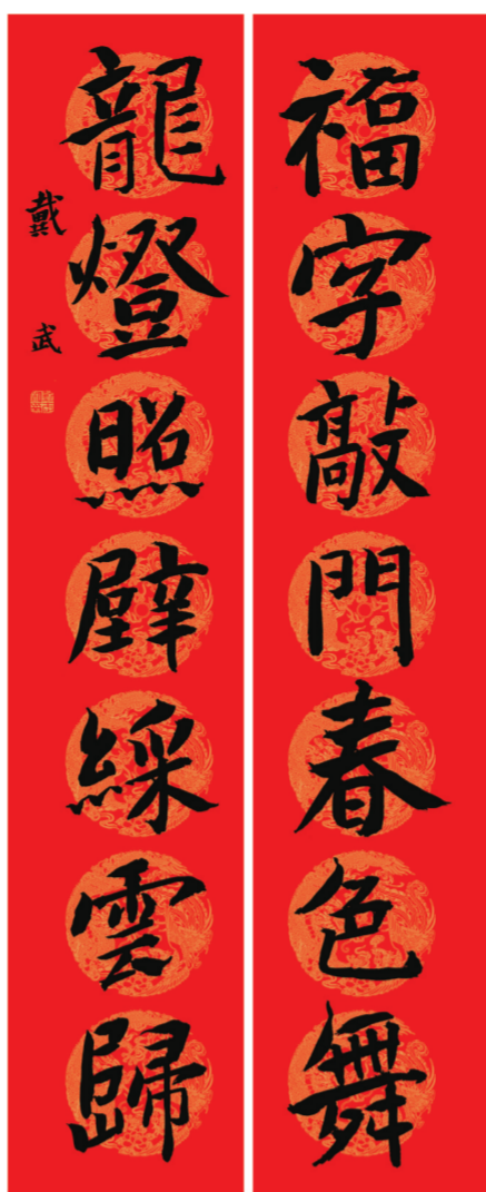
▲楷书 戴武书 (福字敲门春色舞,龙灯照壁彩云归。)

龙腾华夏国兴旺,福降神州民寿康。龙是中华民族的精神象征,更是凝聚中华民族情感的媒介,其丰富多样的象征意义反映了中华民族的历史和文化。在甲辰龙年来临之际,为弘扬中华优秀传统文化,不断推动我市文化艺术繁荣发展,营造欢乐、祥和、喜庆的节日氛围,本版特邀滁州市书法家协会13位主席团成员,让他们用年味十足的春联形式书写自己对家乡的祝福和对人民的美好祝愿!