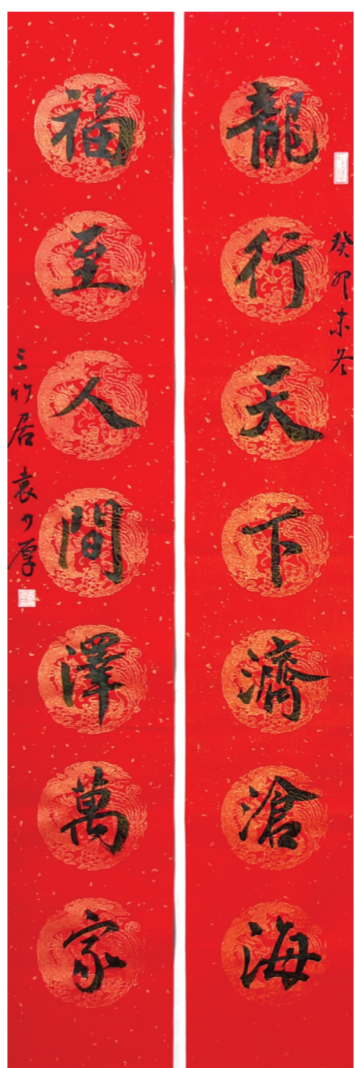
▲行书 袁少厚书 (龙行天下济沧海,福至人间泽万家。)