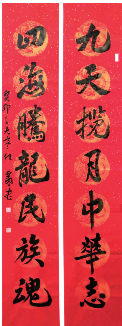
▲行书 任亚弟书 (九天揽月中华志,四海腾龙民族魂。)