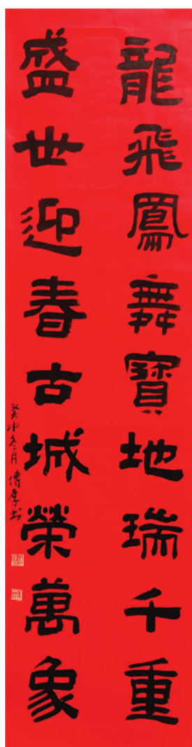
▲隶书 罗传厚书 (龙飞凤舞宝地瑞千重,盛世迎春古城荣万象。)