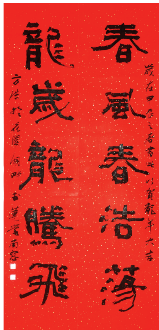
▲隶书 方洪书 (春风春浩荡,龙岁龙腾飞。)