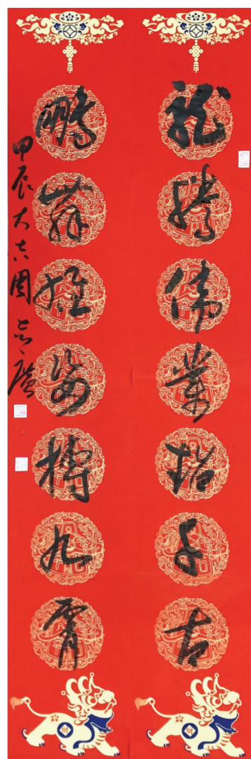
▲行书 周志广书 (龙腾伟业超千古,鹏舞雄姿搏九霄。)