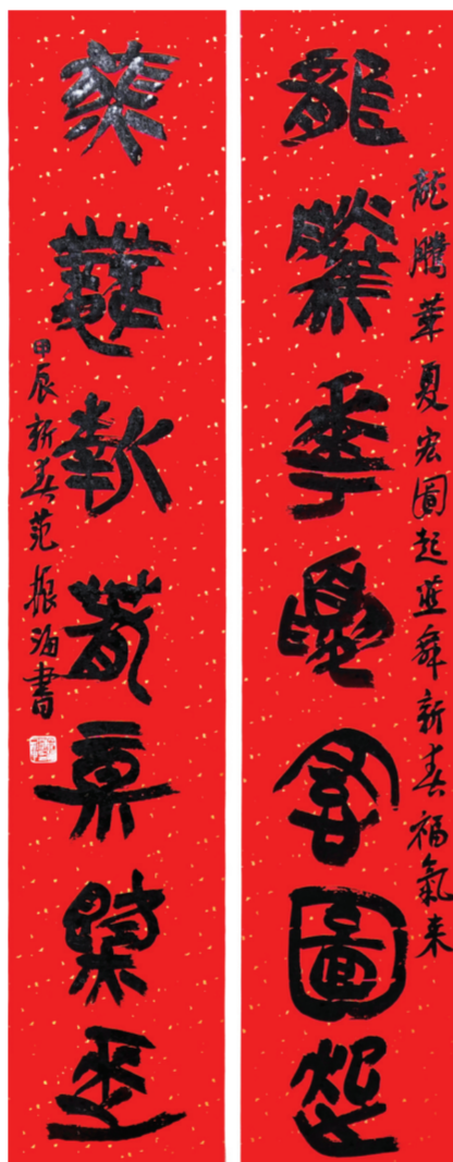
▲篆书 范振涛书 (龙腾华夏宏图起,燕舞新春福气来。)