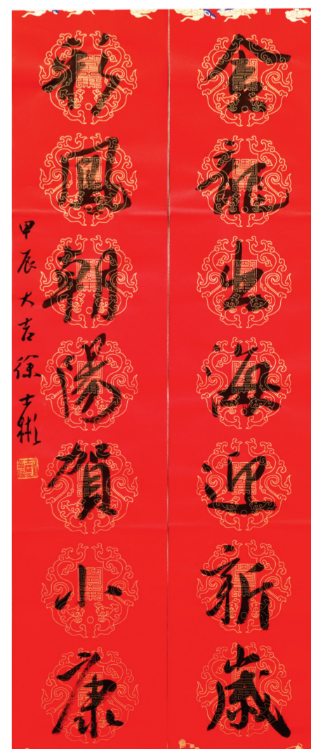
▲行书 徐士彬书 (金龙出海迎新岁,彩凤朝阳贺小康。)