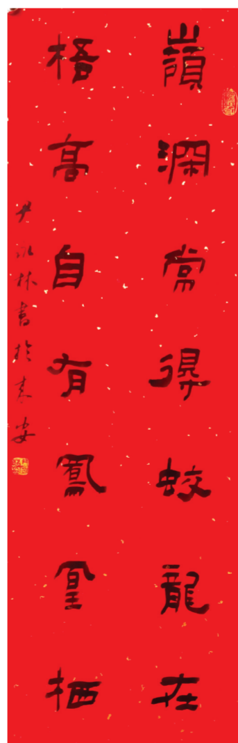
▲隶书 尹永林书 (岭深常得蛟龙在,梧高自有凤凰栖。)