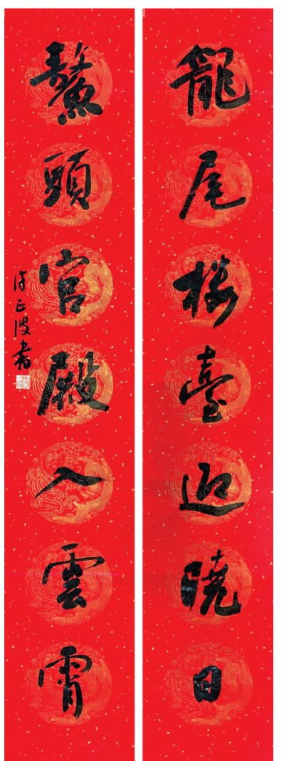
▲行书 许正波书 (龙尾楼台迎晓日,鳌头宫殿入云霄。)