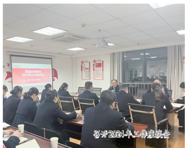
召开创新工作推进会

强国必先强农,农强方能国强。为粮食安全保驾护航,为涉农产业铺路架桥,为乡村建设添砖加瓦,今年以来,凤阳农商银行主动落实与县政府签订的战略合作协议,积极对接政府相关部门,着力加大对重点领域和重点群体的金融支持,始终用实实在在的行动,诠释着本土银行的担当作为。