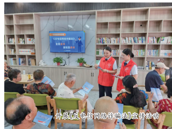
开展《反电信网络诈骗法》宣传活动

持续完善服务通道。引导名录企业在规限时限内完成“信用金融平台”注册、入驻等工作,推动、鼓励名录企业