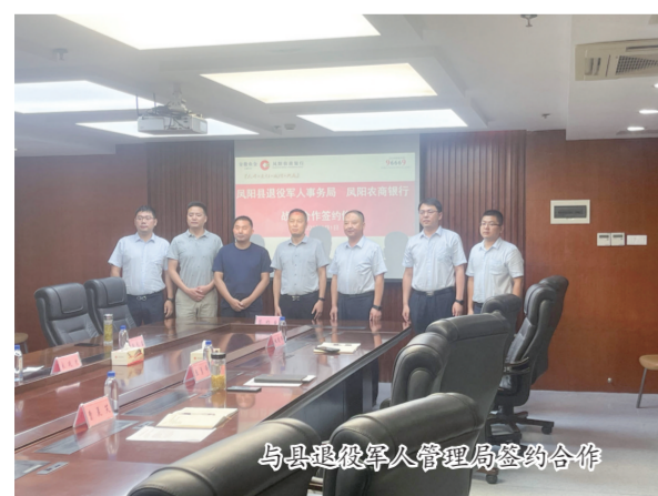
与县退役军人管理局签约合作

积极对接政府相关部门,围绕城乡融合发展类项目、乡村绿色发展类项目等积极对接,加大对农村基础设施建设、人居环境改造、特色产业升级等重点领域、重点项目的跟进和信贷支持。为此,该行创新信贷产品“乡村振兴贷”等信贷产品。截至今年11月末,“乡村振兴贷”发放9户5.68亿元。