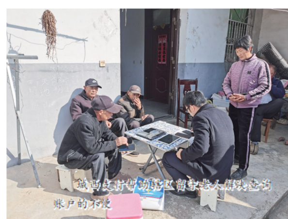
做好信贷工作 助力乡村振兴 农户贷款 账户的不忙

今年以来,该行全面贯彻落实《安徽省金融支持新型农业经营主体发展行动方案》精神,主动加强与政府部门沟通联系,围绕村集体经济、各类合作社、新型农业经营主体、家庭农场等构建金融服务体系,强化信贷资金配套与供应,满足“三农”多层次、多元化、个性化金融需求,强化新型农业经营主体金融支持。