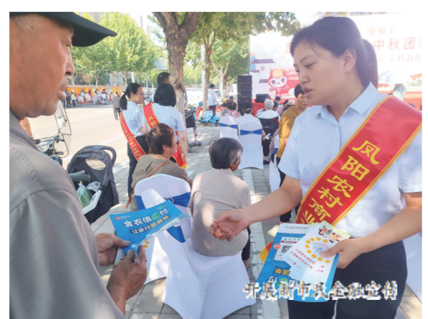
开展村社金融宣传

围绕村集体经济、各类合作社、新型经营主体、家庭农场等农村市场主体,加强政银合作,丰富完善金融服务体系,满足“三农”多层次、多元化、个性化金融需求,创新