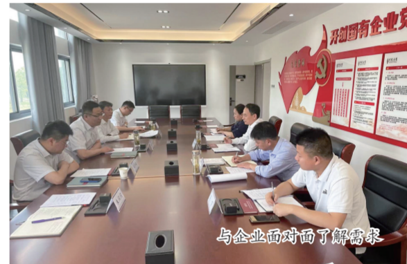
与企业面对面了解需求

自2019年滁州市开展建设省际毗邻地区新型功能区以来，滁州市南谯区与南京市浦口区合作打造的省际毗邻地区新型功能区成为示范基地，该行批复贷款8亿元用于支持园区建设。其中，智能家电产业园工程是毗邻地区重点合作项目，已纳入滁州市及安徽省重点招商引资项目，该项目建成后将成为飞利浦高端智能家电重要生产基地，今年，中国银行滁州分行累计发放项目贷款6.84亿元。