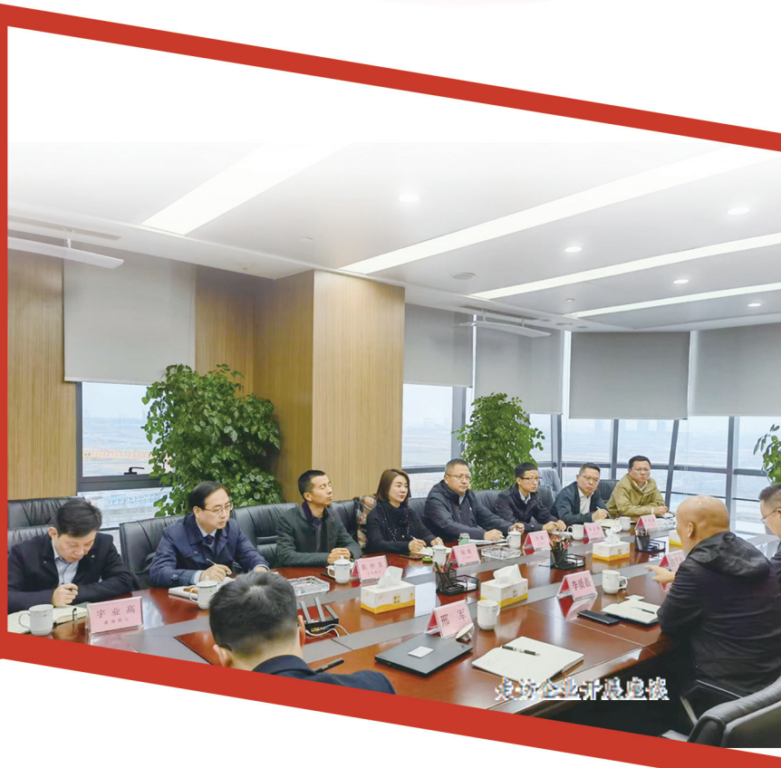
走访企业开展座谈

党的二十大报告指出，中国式现代化是人与自然和谐共生的现代化。尊重自然、顺应自然、保护自然，是全面建设社会主义现代化国家的内在要求。习近平总书记指出，必须牢固树立和践行“绿水青山就是金山银山”的理念，站在人与自然和谐共生的高度谋划高质量发展。