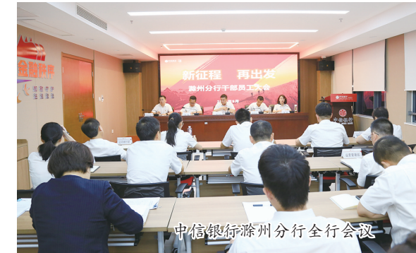
中信银行滁州分行全行会议

健全工作机制，优化保障服务。今年以来中信银行滁州分行深入贯彻习近平生态文明思想，构建以绿色发展理念引领重点领域、战略行业的整体金融服务体系。该行成立了转型发展工作小组，由公司银行部牵头，负责组织推动、业务培训、材料检查以及考核统计，打造更加专业的绿色金融产品体系。