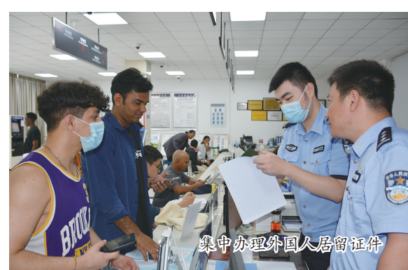
集中办理外国人居留证件

今年3月16日,滁州职业技术学院63名学生在成教院负责人的带领下,来到市公安局出入境大厅办理赴马来西亚思特雅大学开展教学活动的出入境证件,这是该校学生首次赴马来西亚学习。据悉,滁州职业技术学院与马来西亚思特雅大学合作举办动漫制作技术专科教育中外合作办学,是适应国家“一带一路”建设需要,经安徽省教育厅批准,采取“走出去、引进来”开放式的教学模式开展教学活动的重要项目。