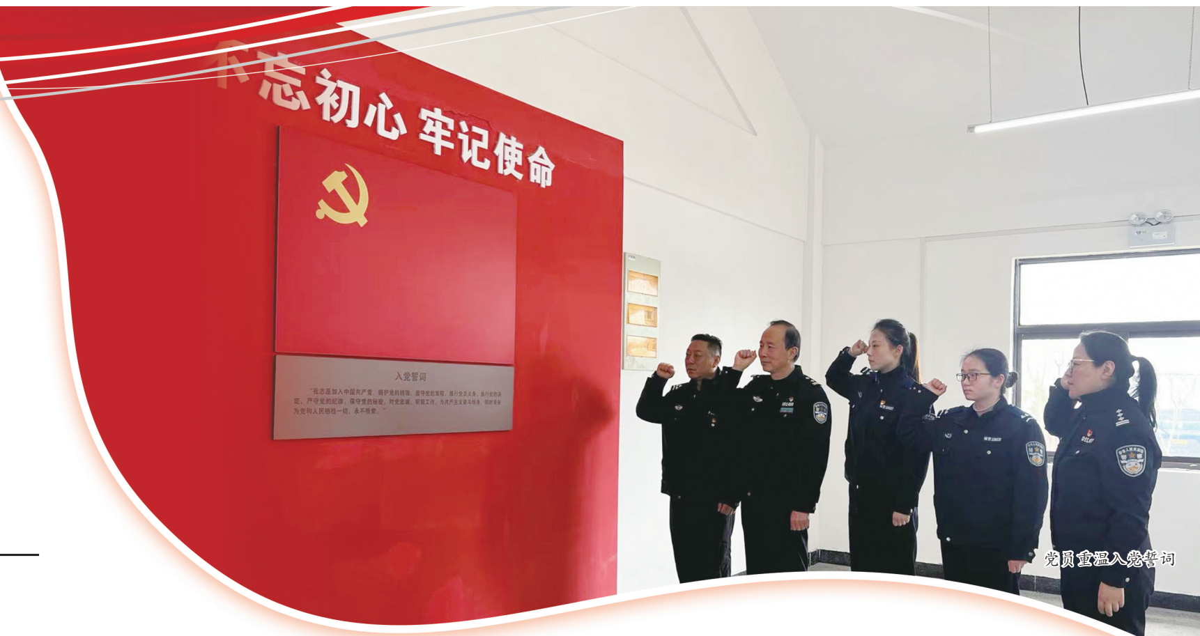
党员重温入党誓词

窗口虽小,责任重大。公安窗口是公安机关沟通、服务群众的桥梁和纽带。近年来,随着公安“放管服”改革的持续深入,我市公安局连续出台多项便民措施,尤其是行审科窗口和出入境管理窗口,着力聚焦群众关注的焦点、热点,把群众满意度作为衡量工作质效的标准,出实招硬招,解决人民群众“急难愁盼”问题,打造有温度的窗口服务,提升服务品质和群众满意度。