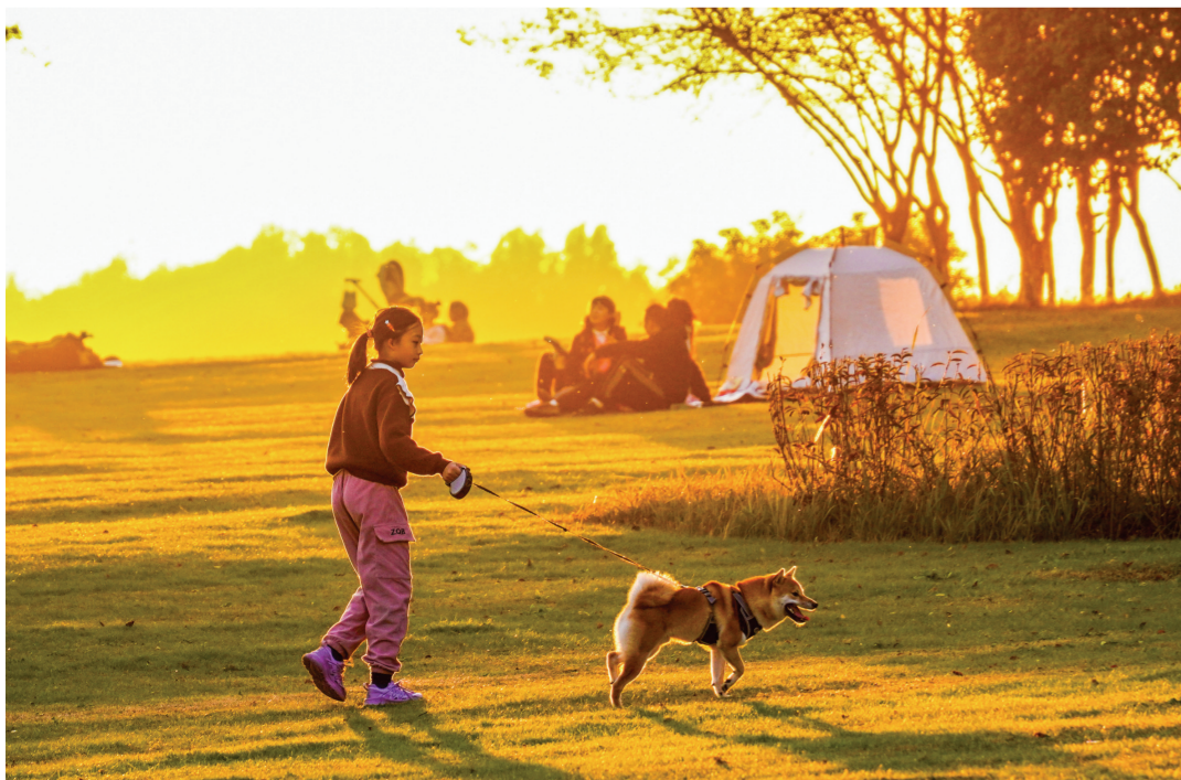
周末时光