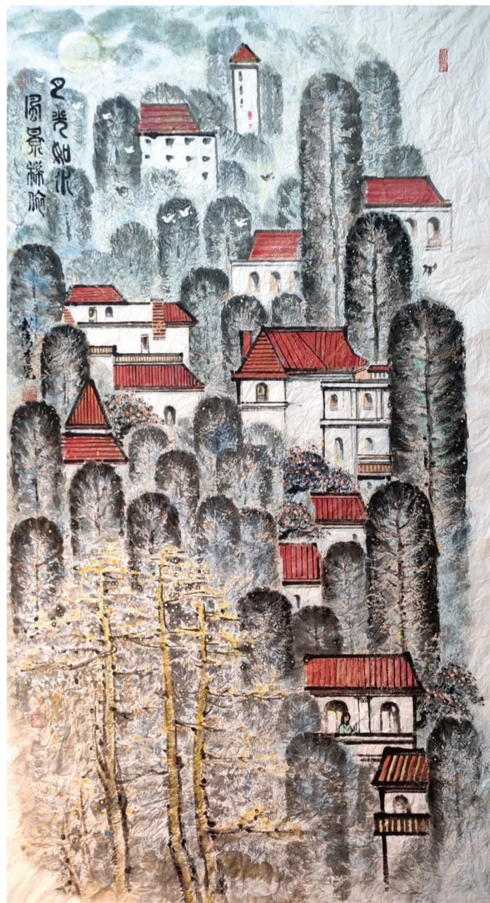
▲月光如水,风景相依