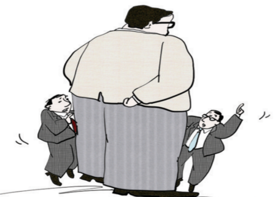
针尖不大扎人最疼，舌头无骨伤人最深。