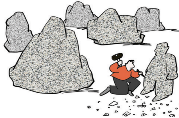
机遇像一块粗糙的石头，只有在雕刻家手中才能获得新生。