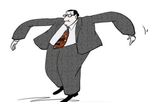
如果不是怕其他人捡起，很多东西，我们都会扔掉。