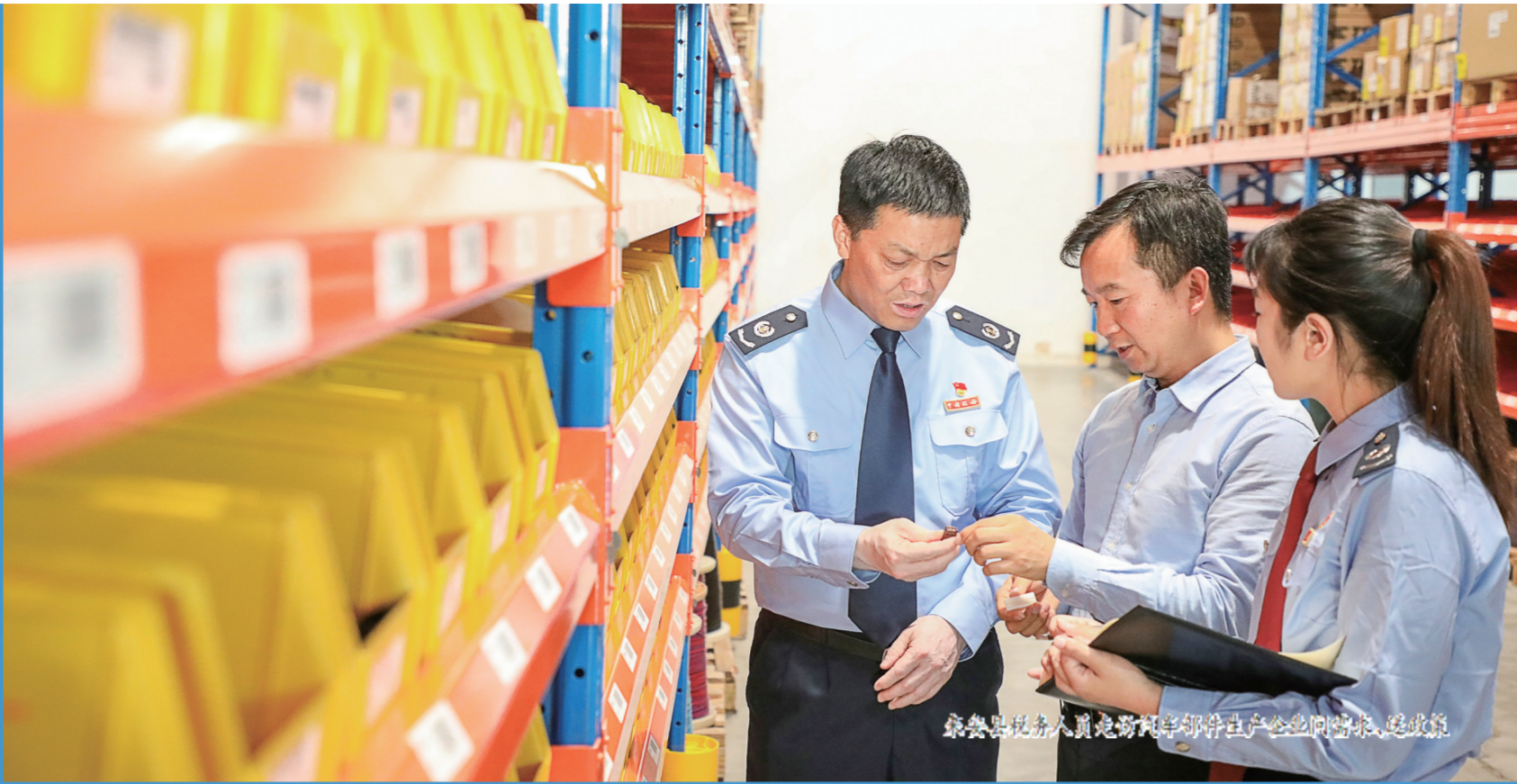
全椒县税务人员走访调研电子产品生产企业问需求、送政策