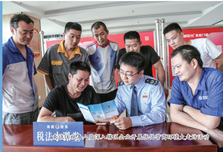
南谏区税务人员深入辖区企业开展优化营商环境大走访活动