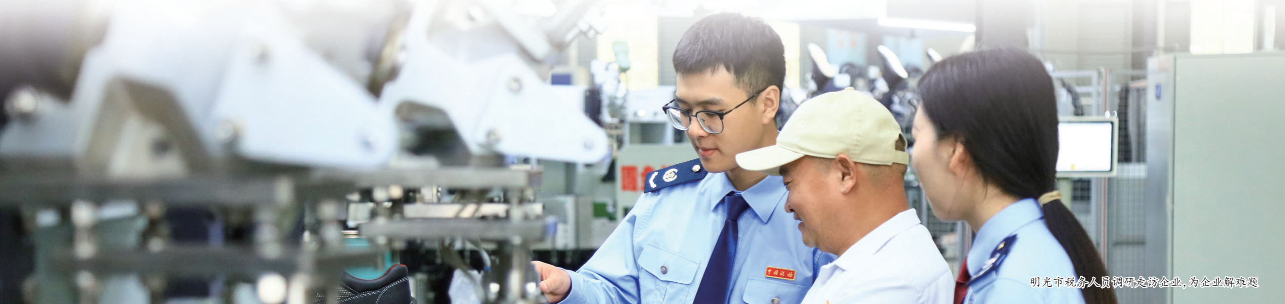
明光市税务人员调研走访企业，为企业解难题

民营经济是保障民生、促进创新、推动高质量发展的核心力量。滁州市税务部门将进一步深入一线听呼声、办实事、解难题，以更精准的政策落实、更精细的税费服务、更强劲的解难力度助力民营企业走向更加广阔的舞台。