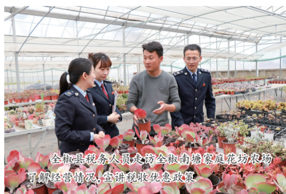
全椒县税务人员走访全椒南谏家庭农场了解经营情况，宣讲税收优惠政策

39666万美元，同比增长9.5%。成绩的背后，离不开全椒县税务部门加大外贸新业态扶持力度，不断完善分类分级管理机制，实施智能化管理，为出口退税、留抵退税等事项办理按下“加速键”。